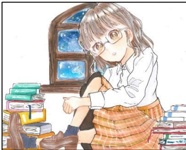
最優秀賞 今日の気分はオムライスさん (みどり台中学校)