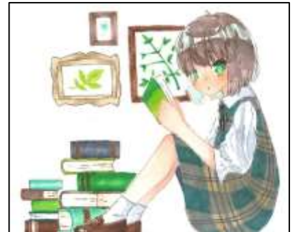
びえろさん (増田中学校)