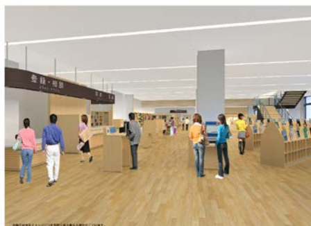
2階フロアイメージ