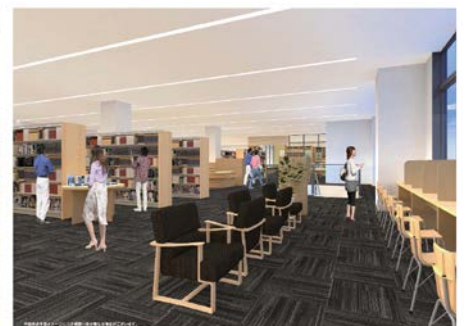
3階フロアイメージ