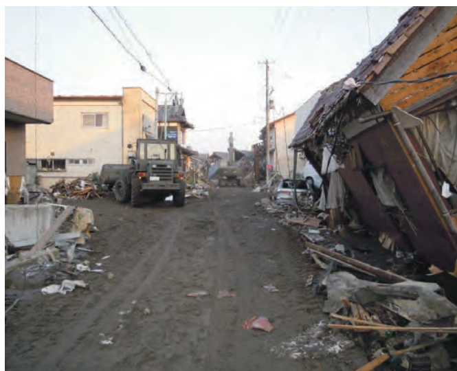
155 平成23年3月13日 名取市