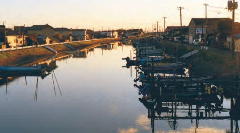
平成22年12月7日