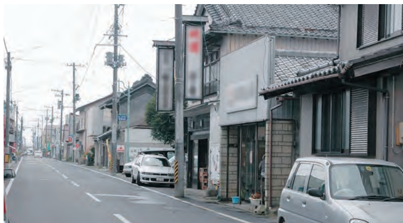
平成20年8月9日