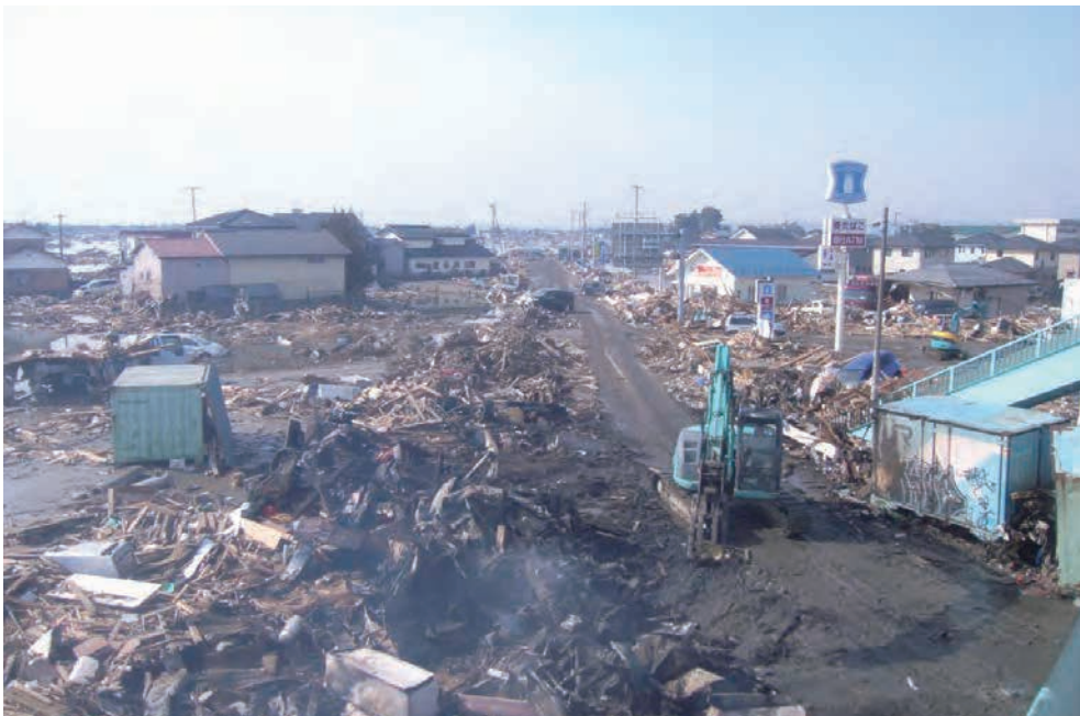
関上五叉路付近 啓開しているのは、 県道「塩釜-亘理線」。 157 平成23年3月13日 （株）ワタケン