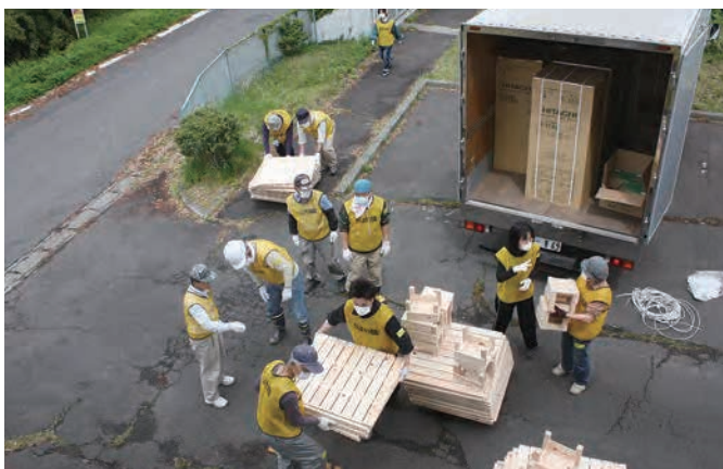
仮設住宅入居の手伝い