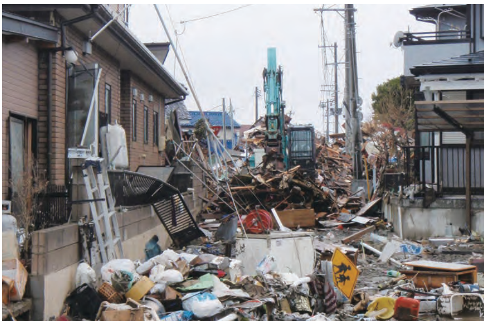
161 平成23年3月16日 名取市