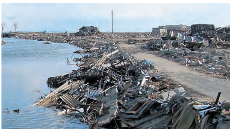
平成23年3月17日