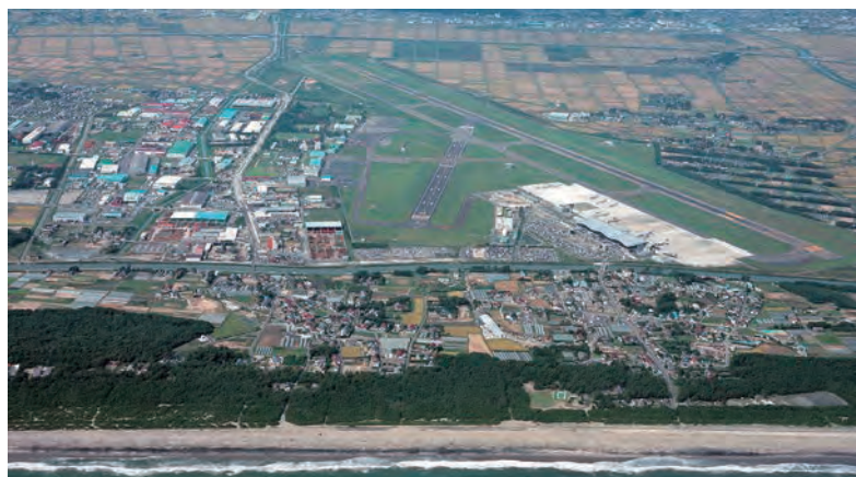
仙台空港と下増田地区の町並み

平成11年9月