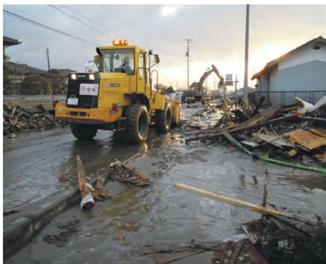
内陸部から閉上へ向う「閉上街道」 154 平成23年3月12日 名取市