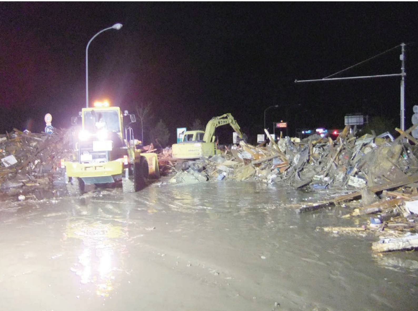
夜を徹して行われた懸命な道路啓開作業 「閉上街道」の仙台東部道路名取インターチェンジ付近。 153 平成23年3月12日 名取市

人命の救助を最優先とするため、名取市における道路の啓開作業の着手は早く、市内の建設業組合の協力を得て当日の夕方6時頃から作業を開始し、夜を徹して作業を進め、翌朝には閉上まで到達した。 その後、順次範囲を広げながら人命救助のための道を切り開いた。