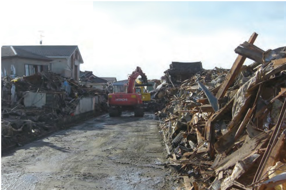
159 平成23年3月16日 名取市