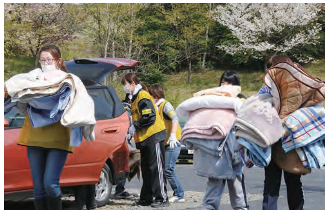
仮設住宅入居の手伝い