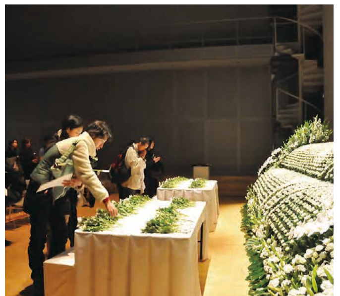
名取市合同慰靈祭