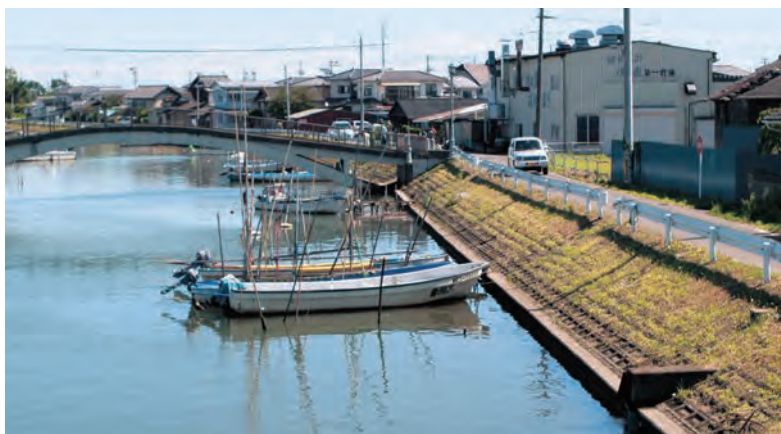
平成21年8月13日