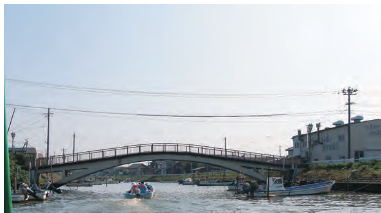
平成20年7月12日