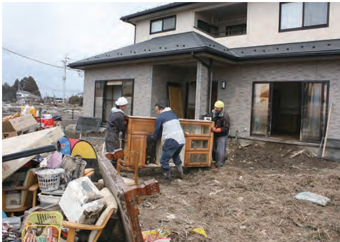
家屋の整理