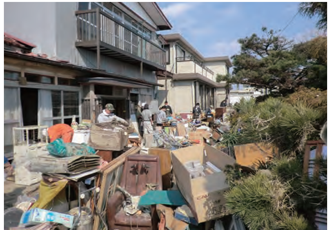
家屋の整理