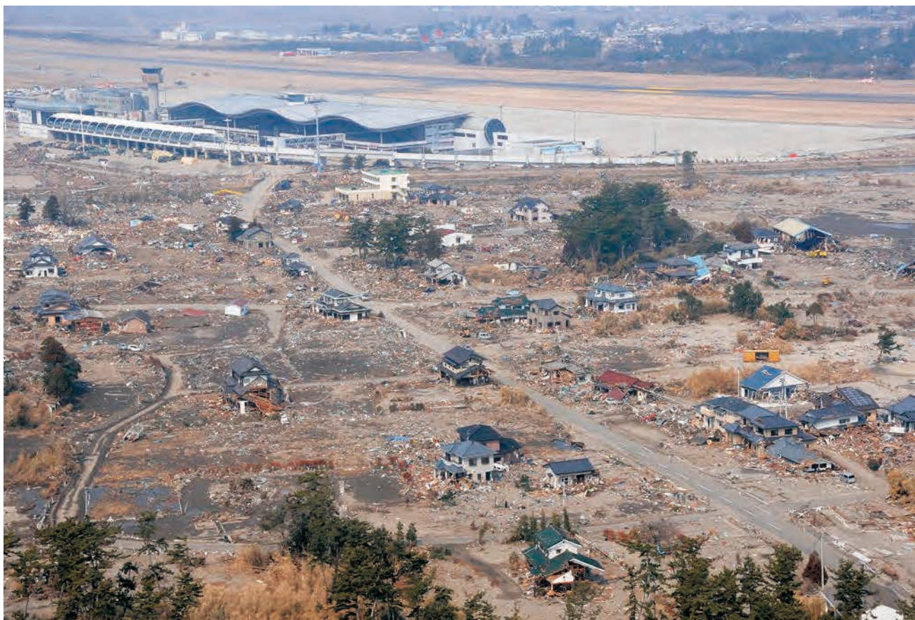
平成23年3月30日