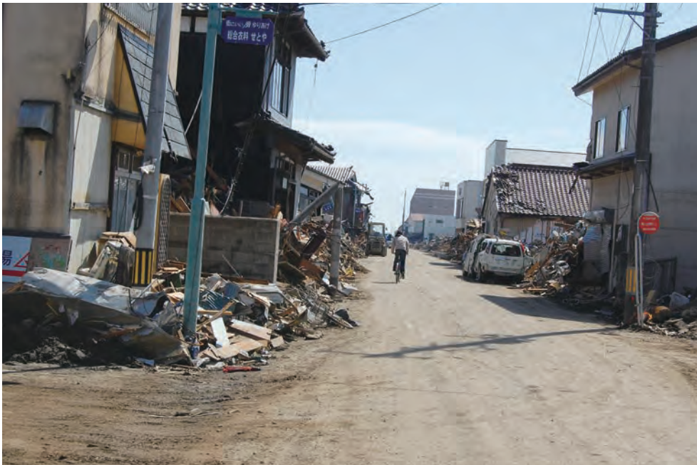
震災1週間後の関上