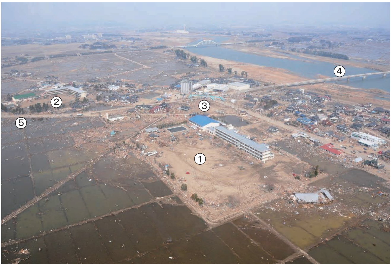
①関上中学校 ②関上小学校 ③五叉路 ④関上大橋 ⑤県道10号「塩釜－亘理線」 平成23年3月30日