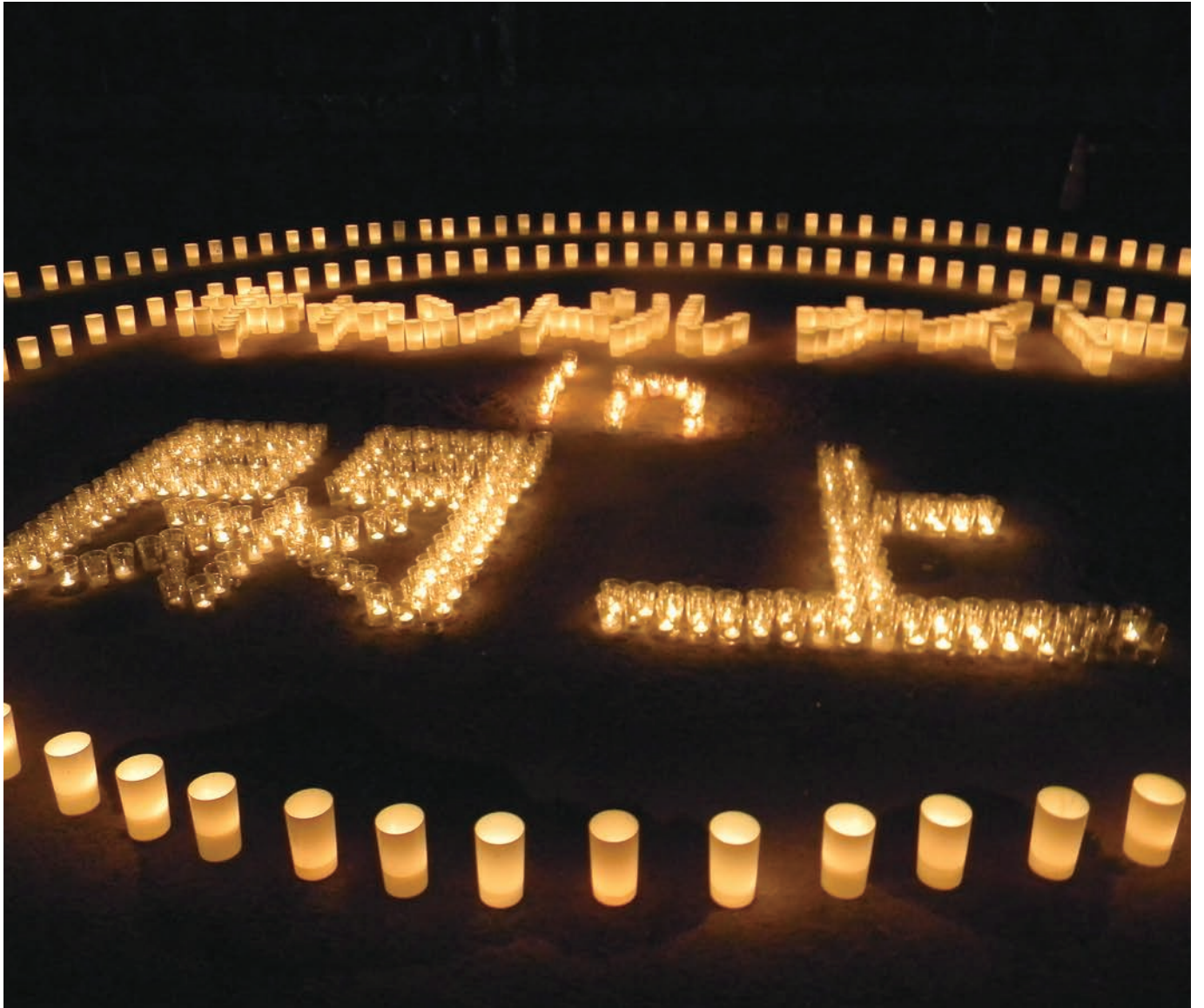
キャンドルナイト in 閑上 平成23年8月13日