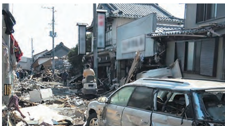
平成23年3月13日