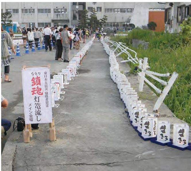
なとり鎮魂灯籠流し