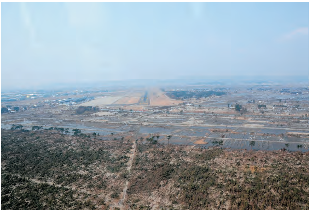
平成23年3月30日