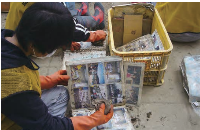
写真の洗浄