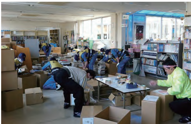
図書館の引っ越し作業