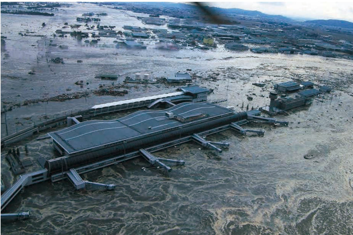
平成23年3月11日