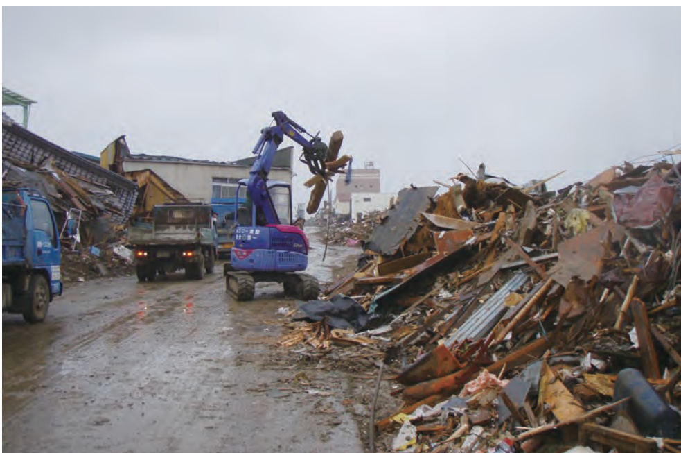
158 平成23年3月15日 名取市