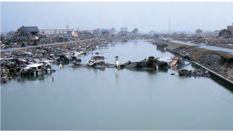
平成23年3月15日