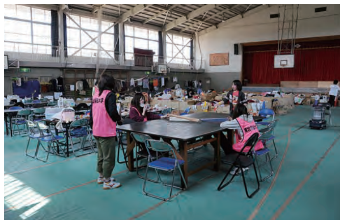
避難所での活動