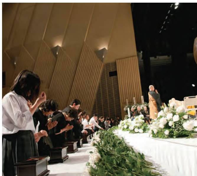
名取市合同慰靈祭