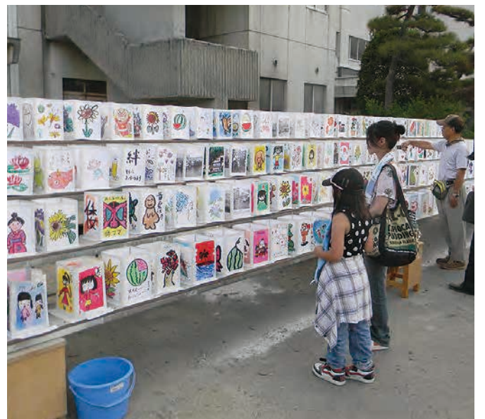
なとり鎮魂灯籠流し