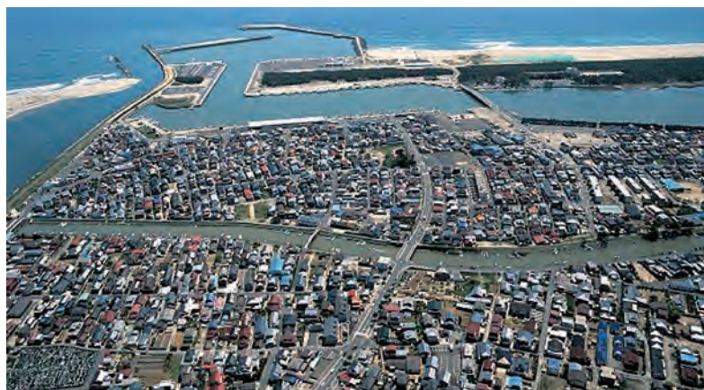
関上港と関上地区沿岸部

平成19年5月