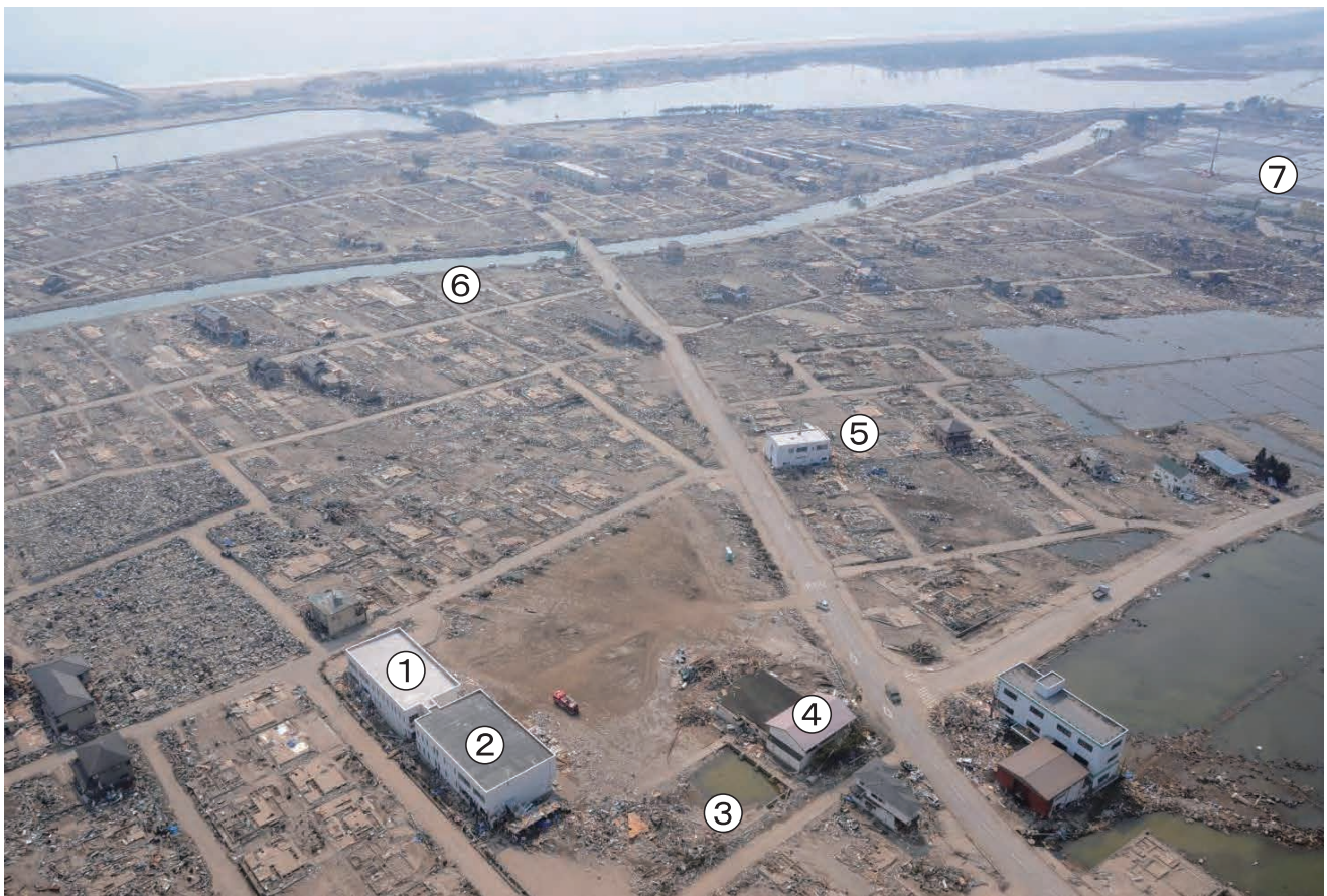
①働く婦人の家 ②関上公民館 ③関上体育館跡 ④関上児童センター ⑤消防署関上出張所 ⑥貞山運河 ⑦老人ホーム「うらやす」 平成23年3月30日