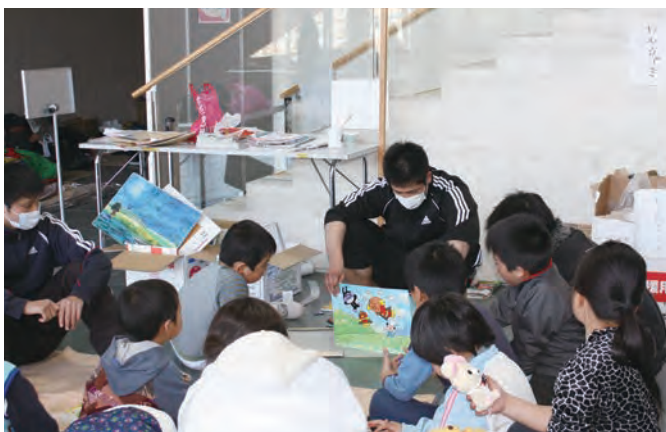
紙芝居の読み聞かせ