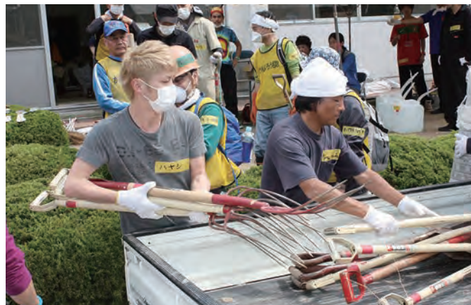
使用資材の積み込み