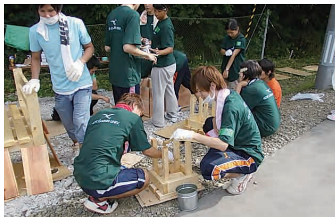
仮設住宅のベンチの設置