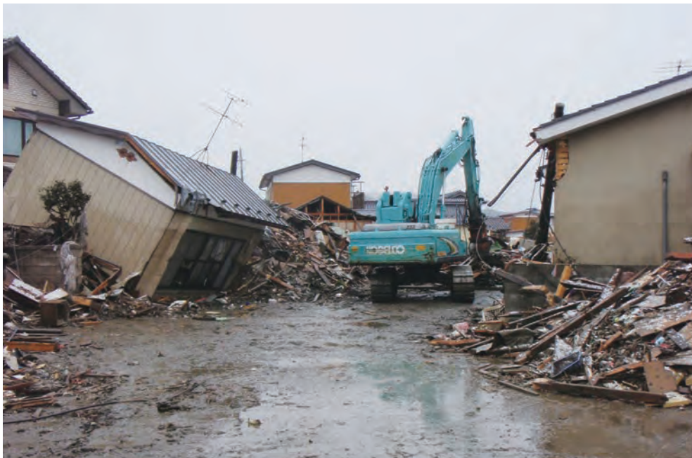
160 平成23年3月16日 名取市