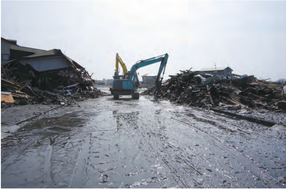
156 平成23年3月13日 名取市