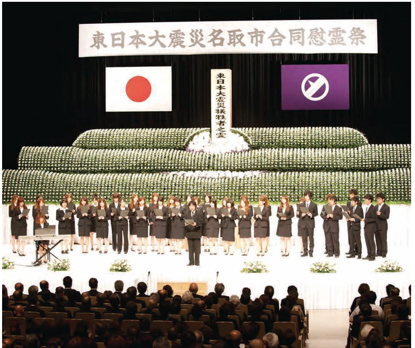
名取市合同慰靈祭 平成23年6月18日