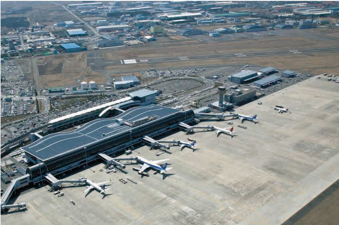
平成22年4月4日