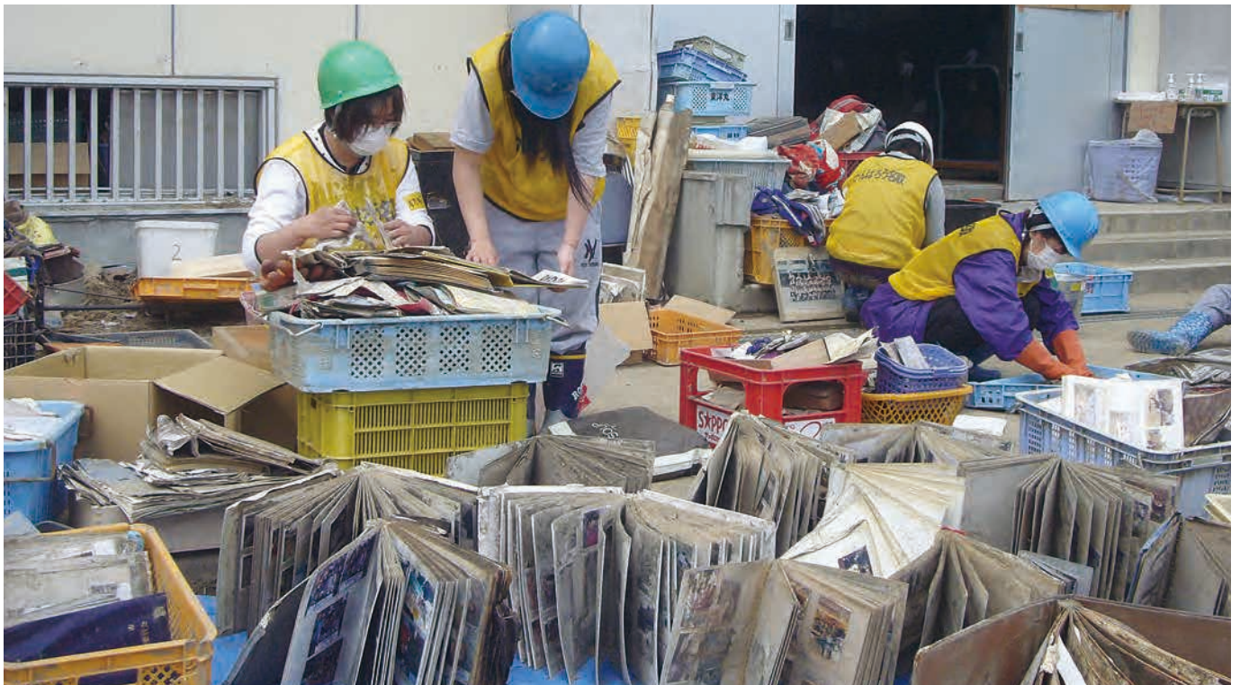
写真の洗浄 平成23年4月16日