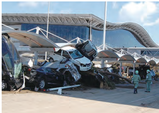
仙台空港ターミナルビル前 ⑬1 平成23年3月18日 個人