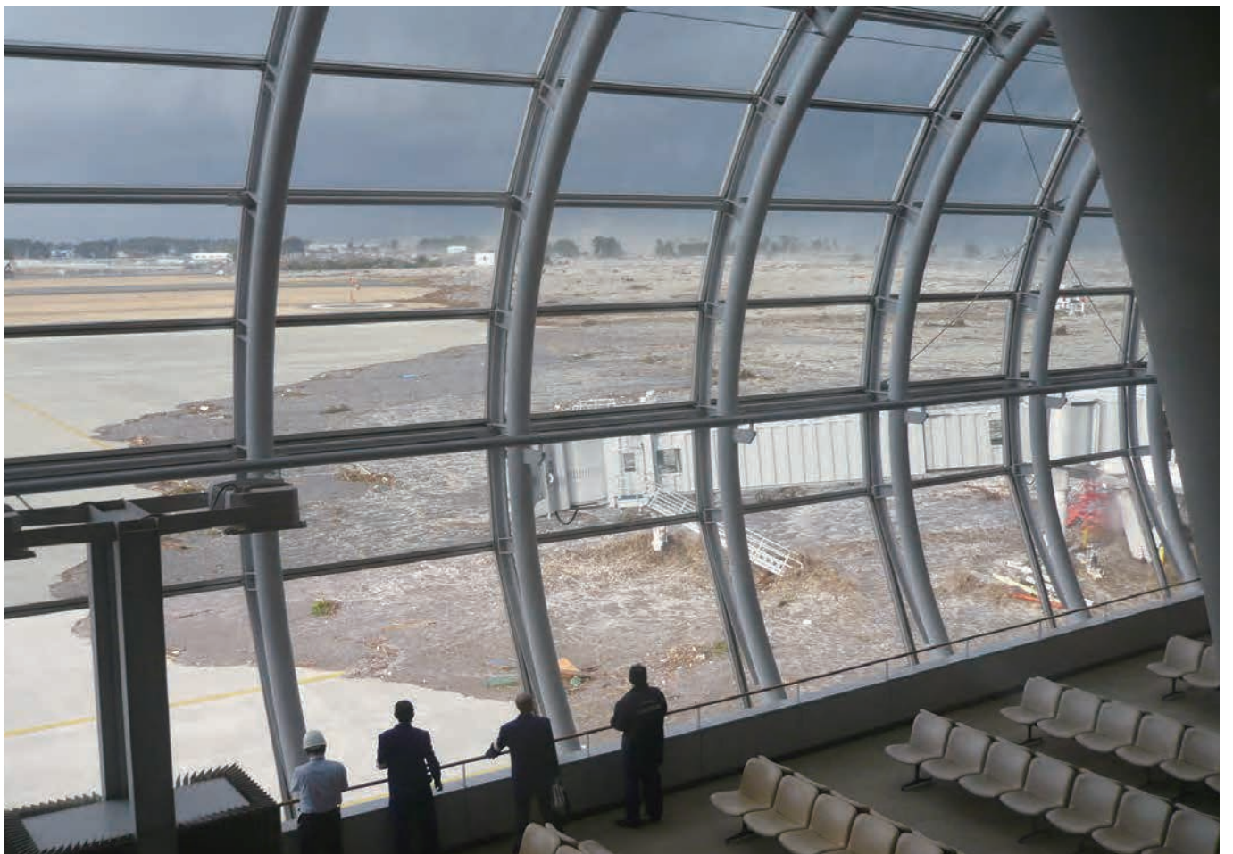
仙台空港ターミナルビルから見た滑走路 津波が押し寄せて来た瞬間。