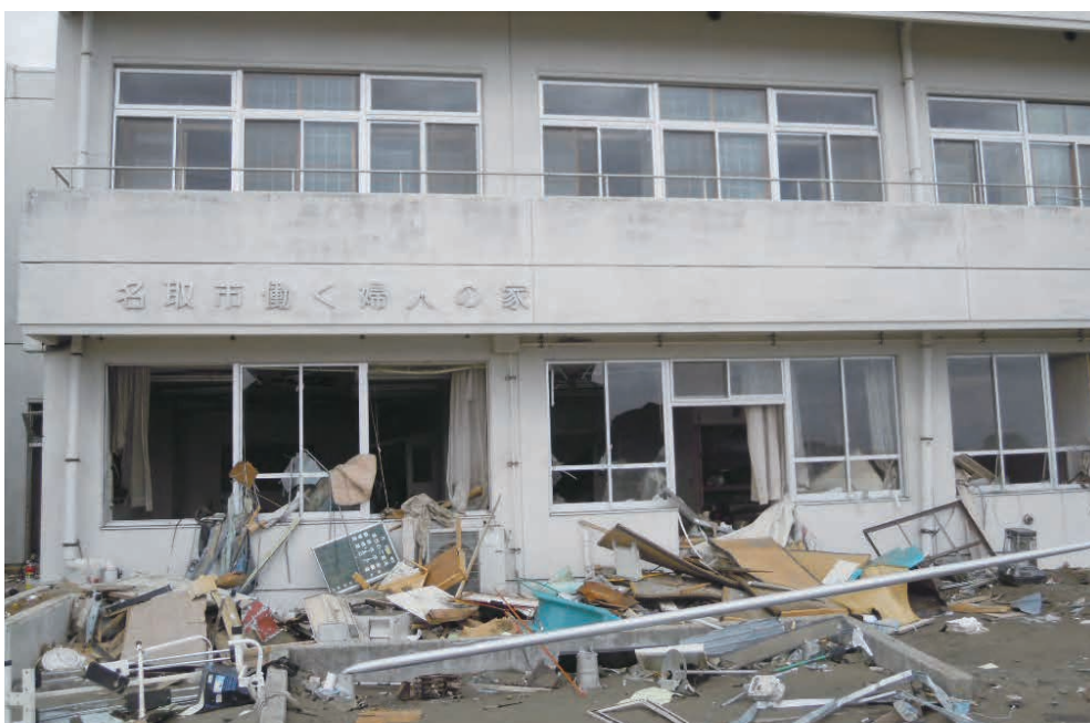
名取市働く婦人の家