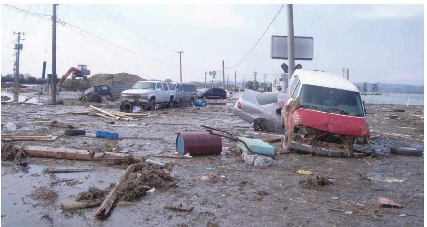
杉ヶ袋地区 県道「塩釜-亘理線」 県南部の海岸沿いを走る主要な県道。電柱の間が道路。