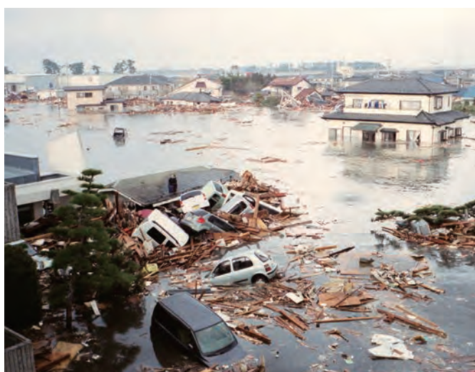
関上中学校の校門付近