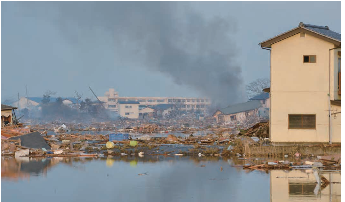
147 平成23年3月13日 東光彦