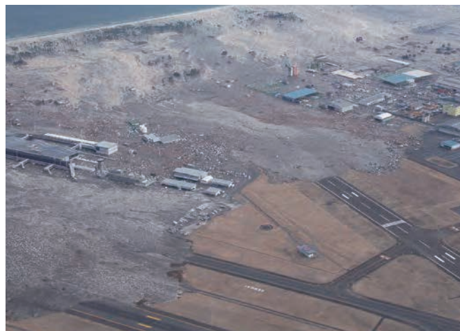
巨大津波にのみこまれていく仙台空港