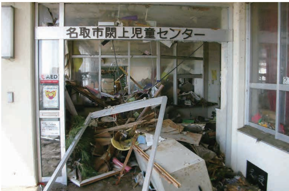
名取市関上児童センター

名取市の沿岸部の公共施設は、 ほぼ全て津波により被害を受け、 その多くは取り壊された。