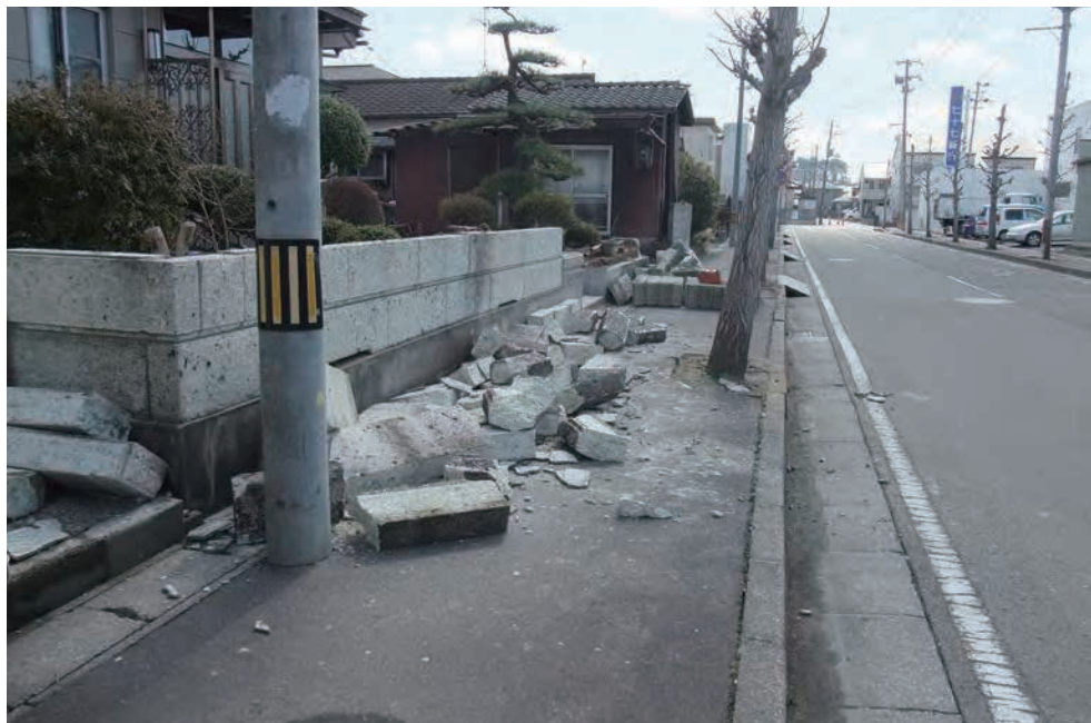
ブロック塀の倒壊

1978年の宮城県沖地震で大きな被害を出したブロック塀の倒壊だが、今回も市内で何か所か倒壊した。