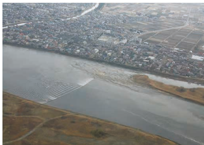
名取川を遡上する津波