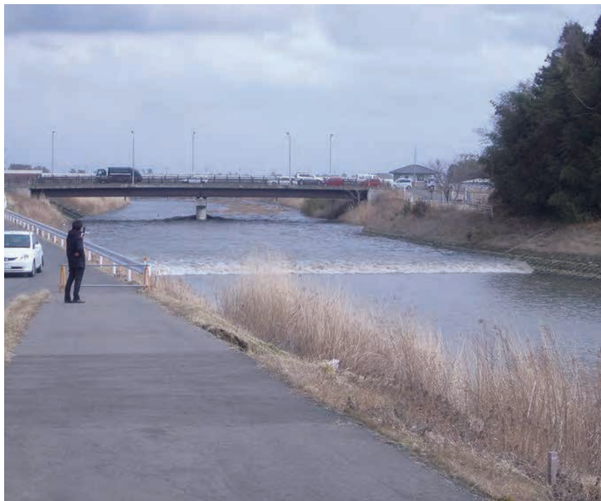
下増田地区内陸部