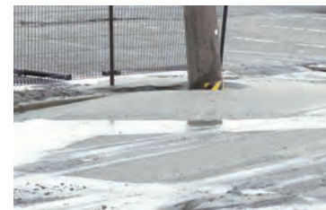
液状化現象により電柱が埋没、道路には砂と水が広がっている。