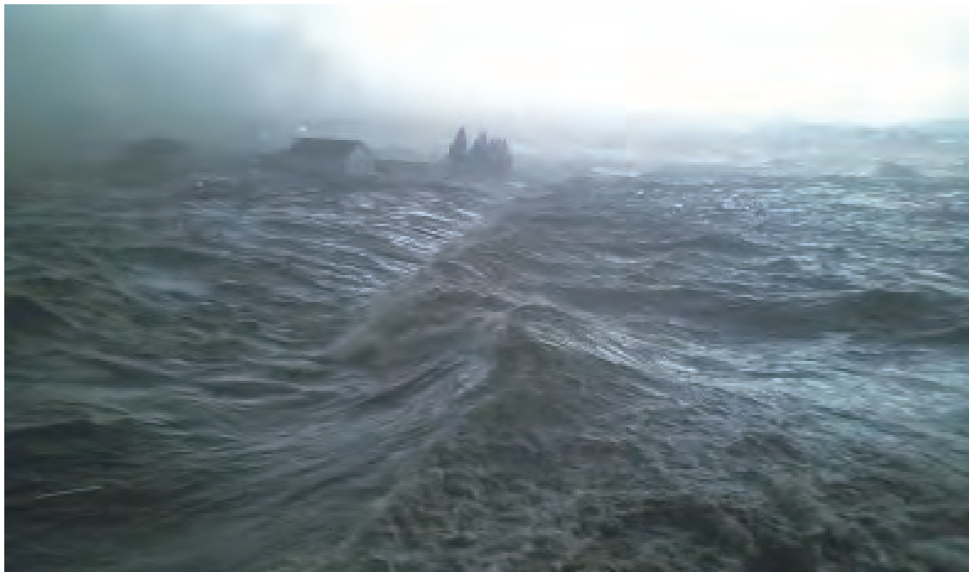
名取市消防署関上出張所付近から撮影