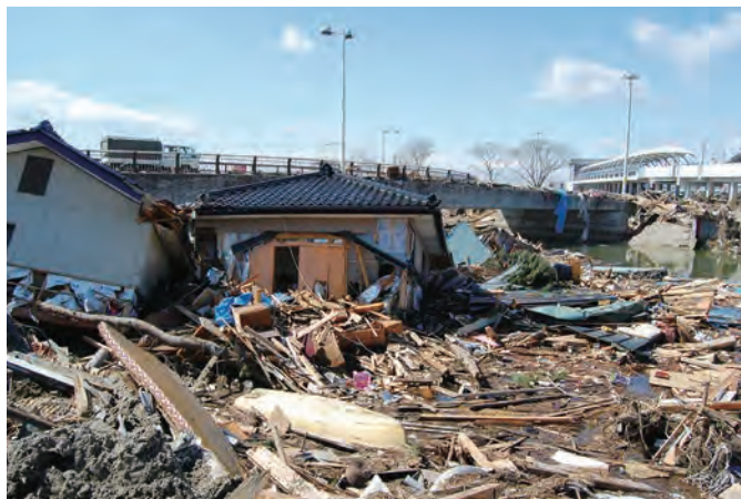
右奥に見えるのが仙台空港アクセス鉄道仙台空港駅 ⑬〇 平成23年3月18日 個人