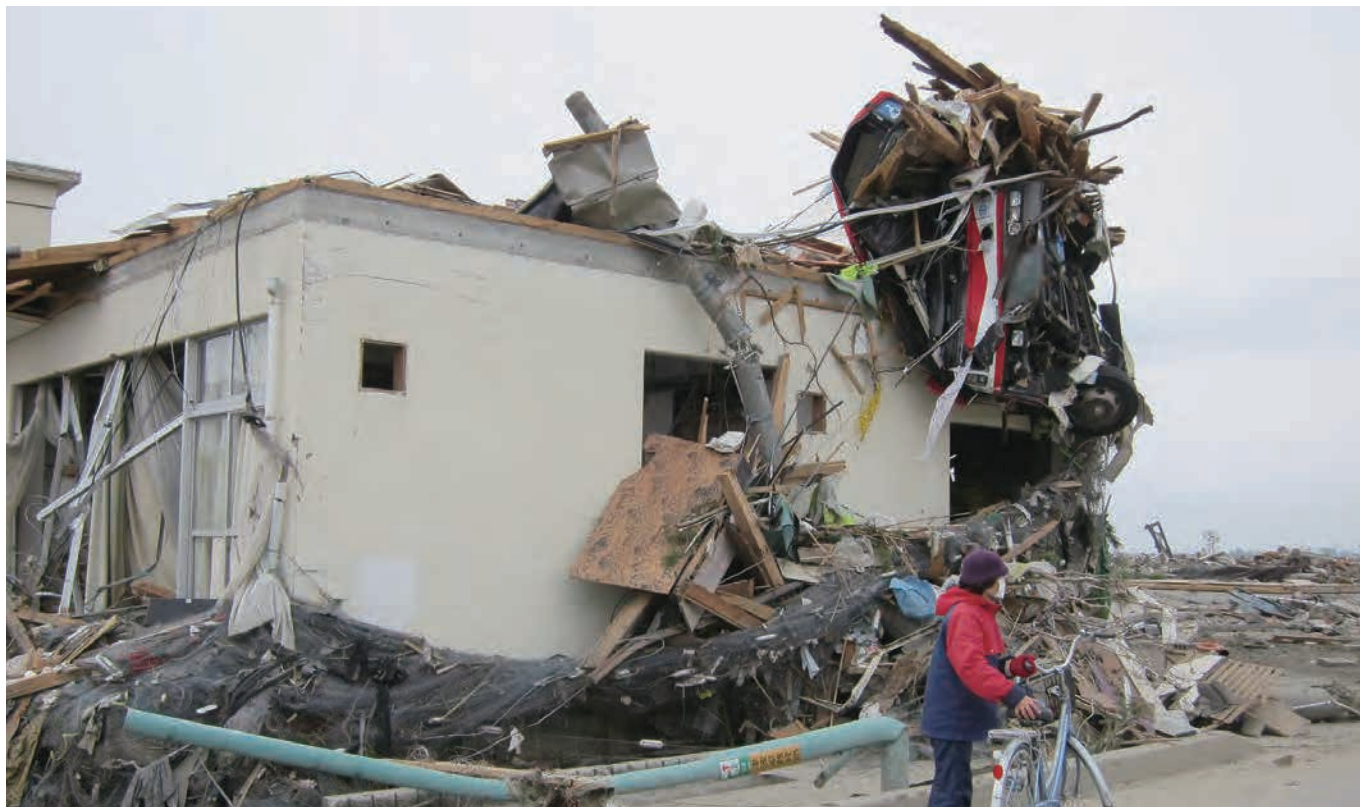
関上6丁目 日和山団地集会所 上に乗っているのは、原型を留めていないカシバである。