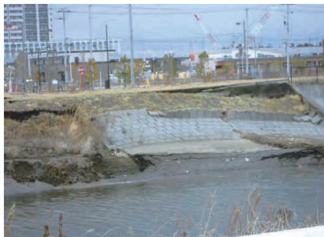
美田園 増田川堤防 土手の一部が崩落。