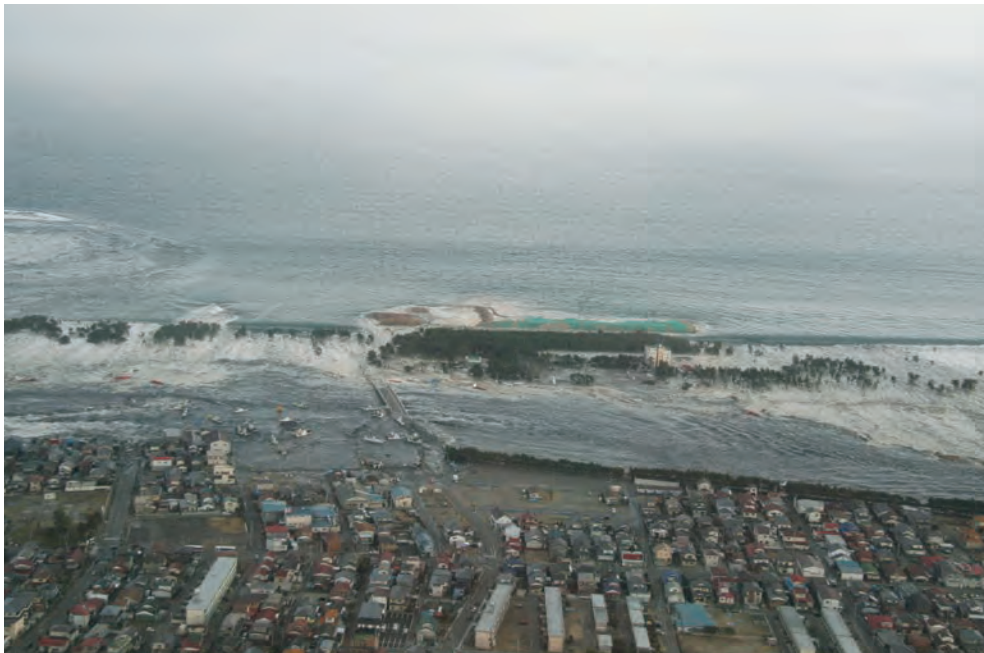
関上の町に押し寄せる津波