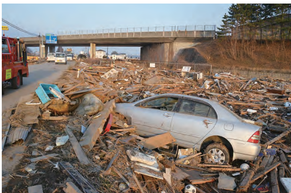
仙台東部道路西側