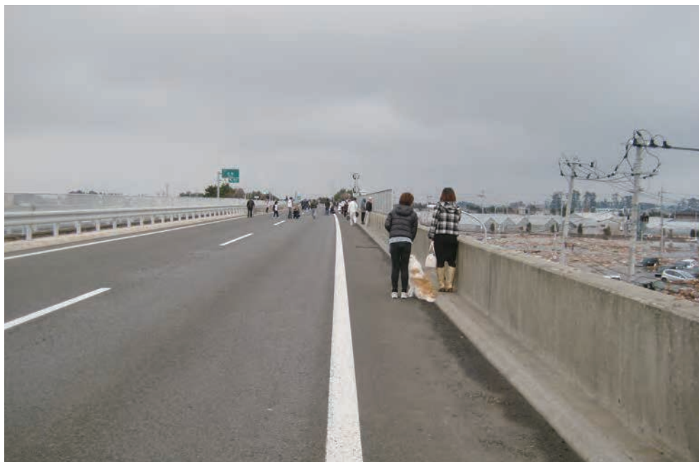
仙台東部道路の名取インターチェンジ 付近に避難する人々

写真右側が海側で、津波が押し寄 せている。 この高速道路が防波堤の役目をし、 津波の多くがここで堰き止められた。