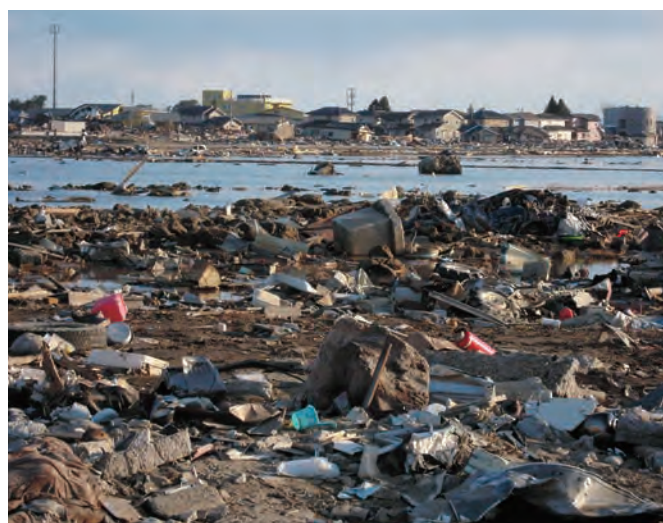
95 平成23年3月27日 高橋祐治