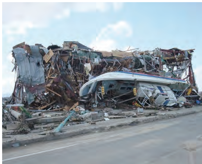
関上4丁目 関上漁港付近