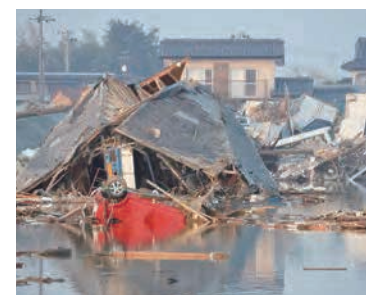
142 平成23年3月13日 東光彦