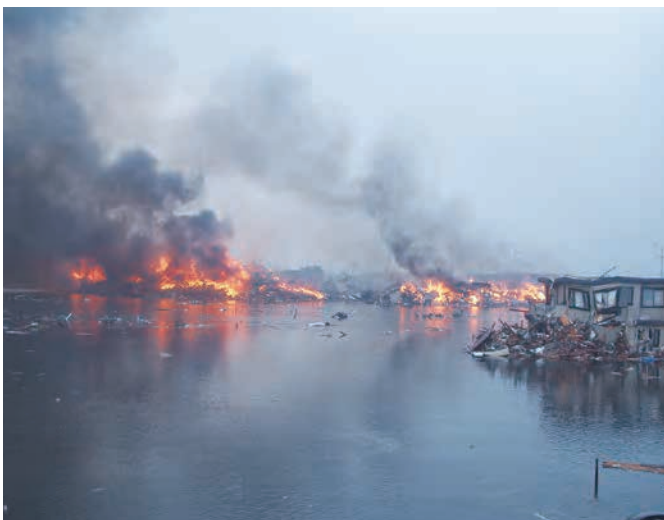
148 平成23年3月11日 松本康裕