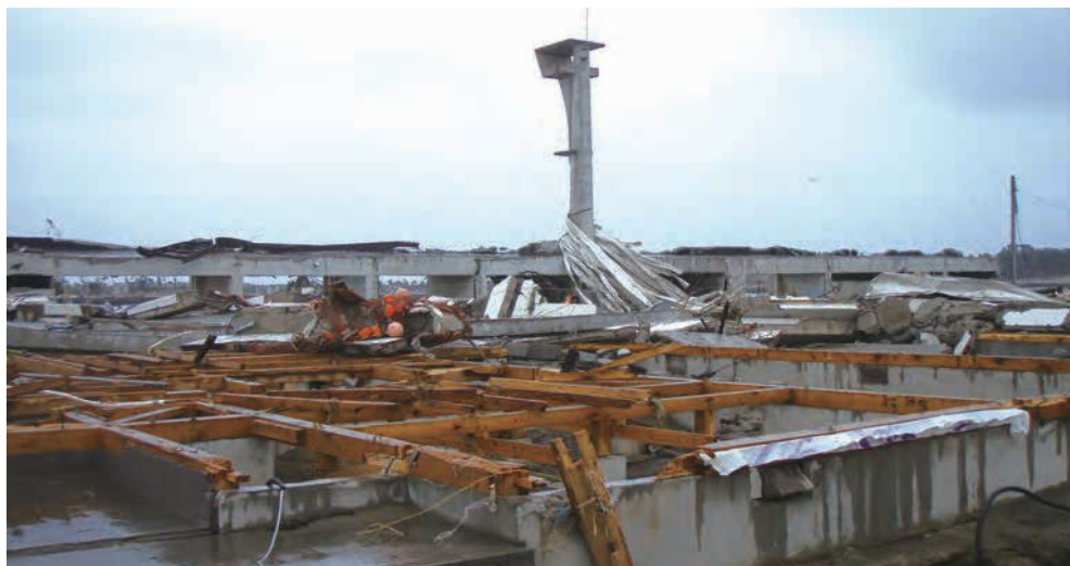
関上漁港魚市場 屋根の鉄板が津波により剥がされ漁港塔に巻き付いている。