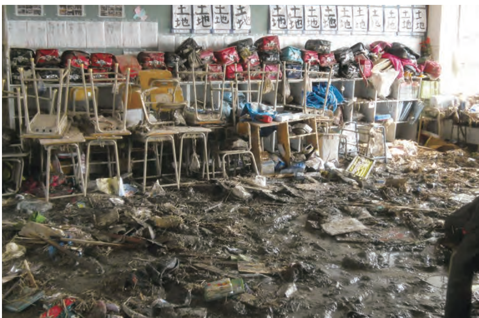
関上小学校1階教室内