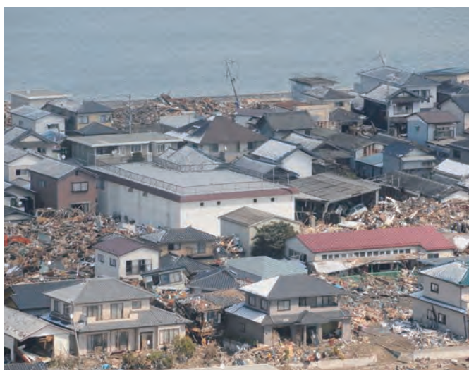
後ろに見えるのは名取川