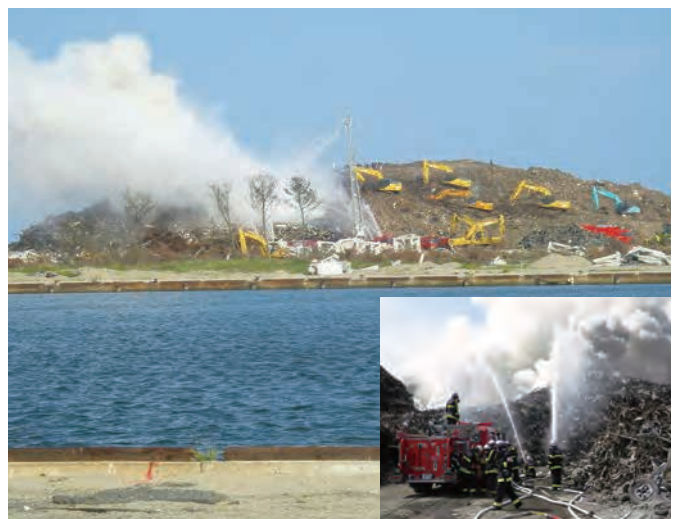
がれき置き場で発生した火災