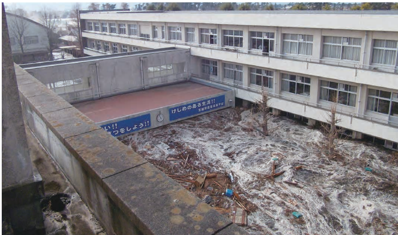
宮城県農業高等学校 校舎は使用不能となり、市の内陸部に移転した。