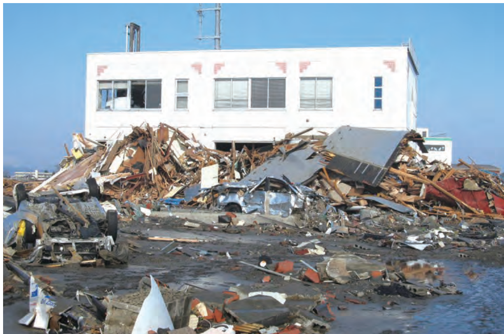
名取市消防署関上出張所