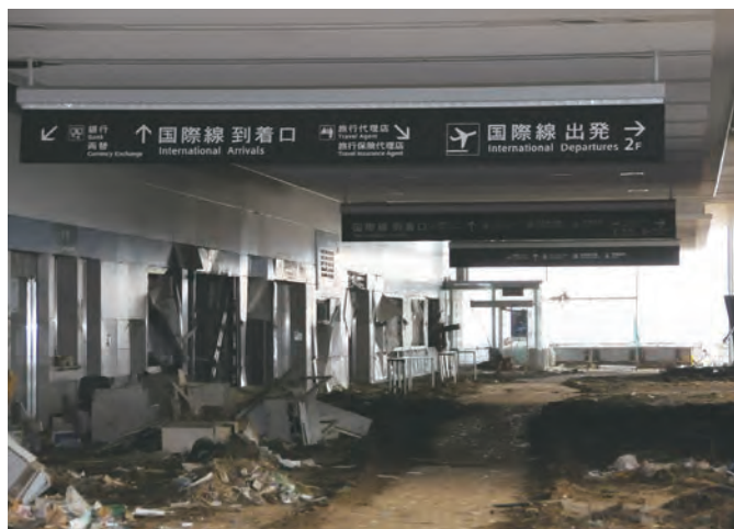
仙台空港ターミナルビル1階内部 ⑬3 平成23年4月2日 名取市