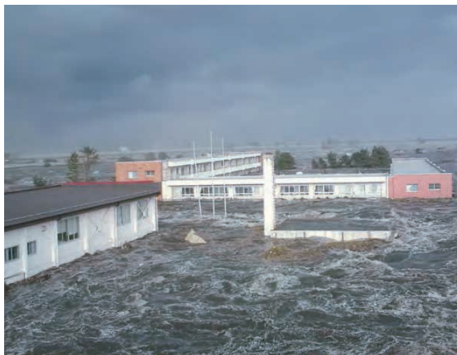
宮城県農業高等学校