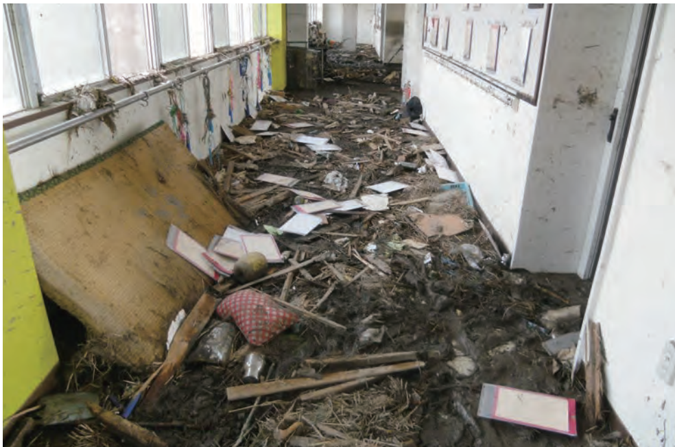
関上小学校1階廊下