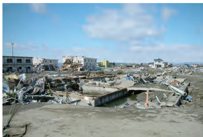
名取市立関上保育所跡 建物は流出し、基礎のみ残る。 迅速な避難により、子どもたちは全員無事だった。