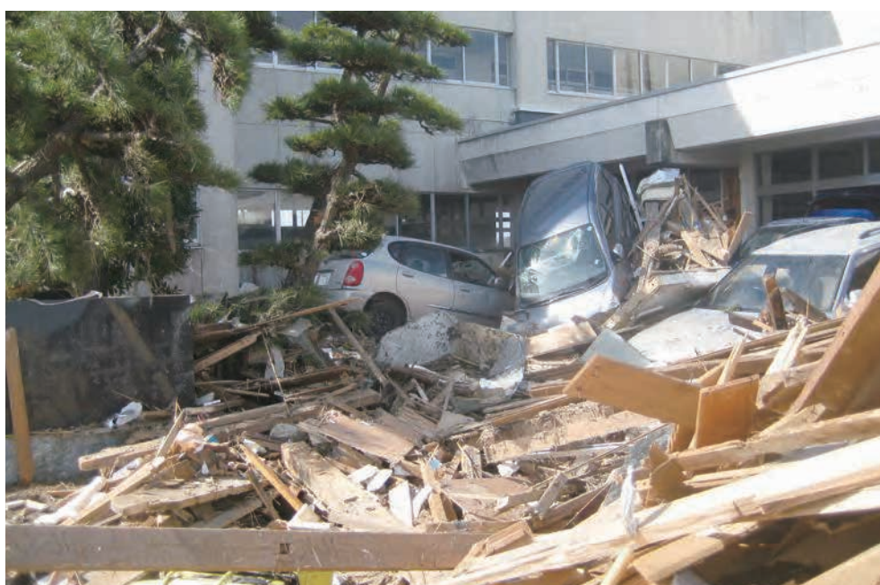
関上中学校昇降口付近