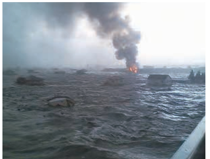
149 平成23年3月11日 金矢泰弘