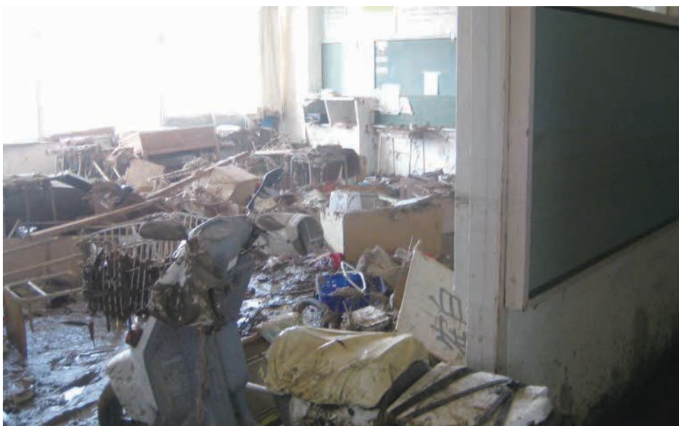
関上中学校1階教室内