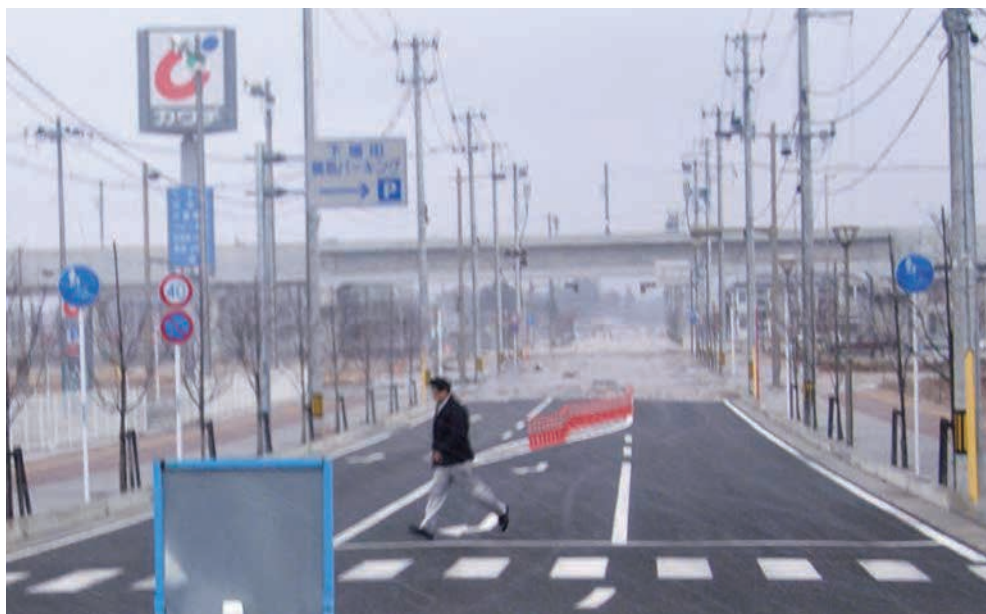
下増田地区内陸部