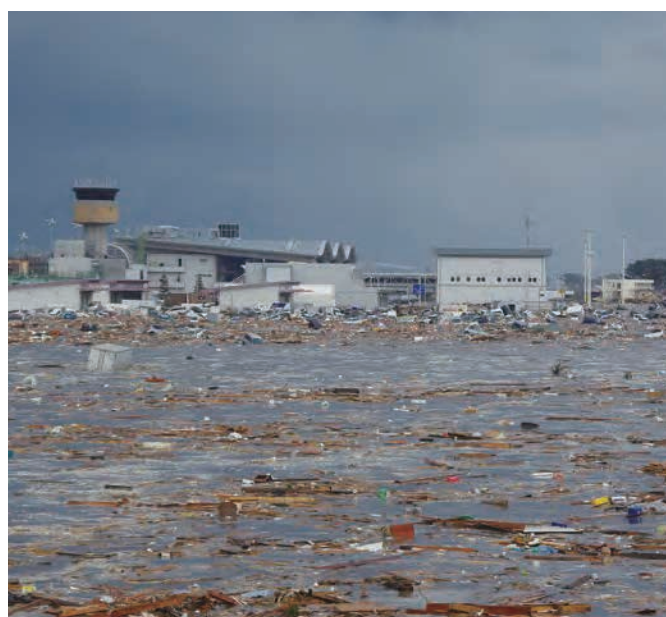
仙台空港の管制塔が見える。㊦ 平成23年3月11日 海上保安庁