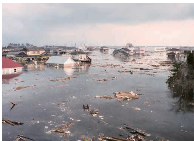
関上中学校から見た関上1・2丁目方面