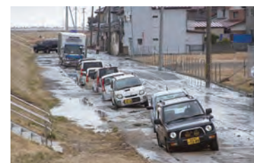
関上4丁目 名取川河口堤防車が砂に埋まっている。