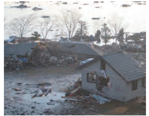
関上中学校校庭 住宅の2階部分が流されてきている。