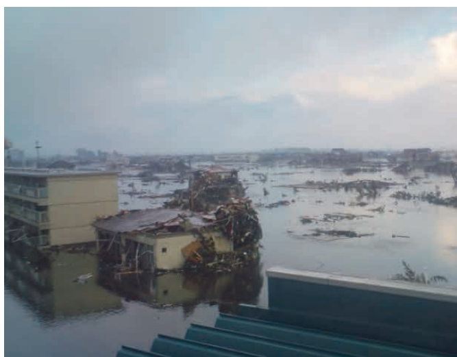
関上5丁目から撮影