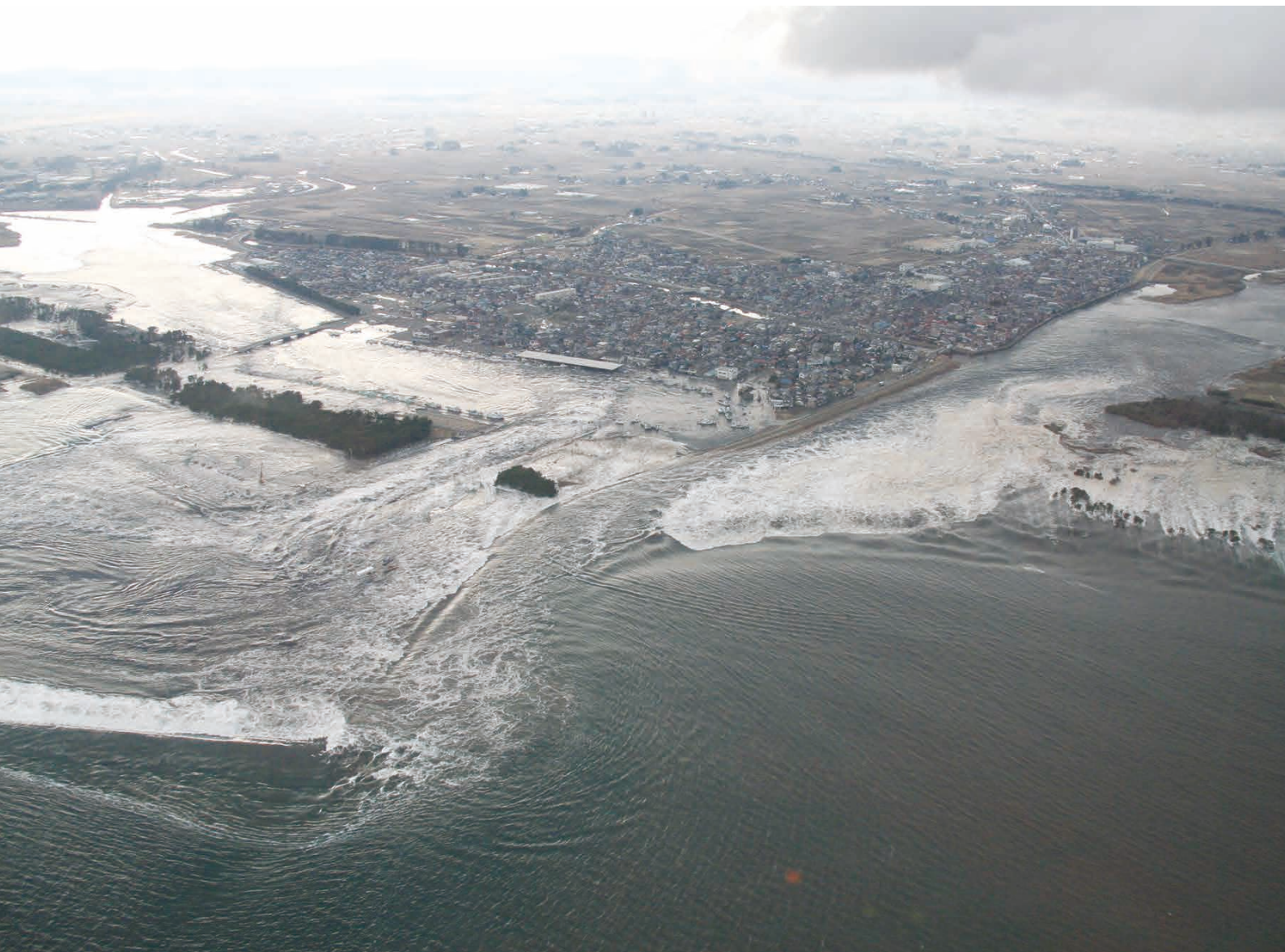
関上港と名取川に流入する津波

まさかこれほど大きな津波が来るとは、誰も予想できなかった。 テレビに映し出される、関上や下増田地区が津波にのみこまれていく光景を初めて見たとき、ほとんどの人は、とても現実の事とは思えなかったのではないだろうか。