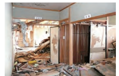
名取市働く婦人の家内部