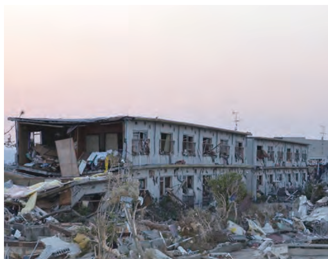
関上6丁目 市営住宅広浦第二団地 78 平成23年3月13日 東光彦