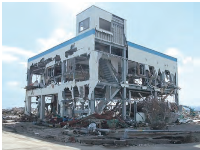
関上4丁目 東北学院シーサイドハウス(ボート部漕艇庫)