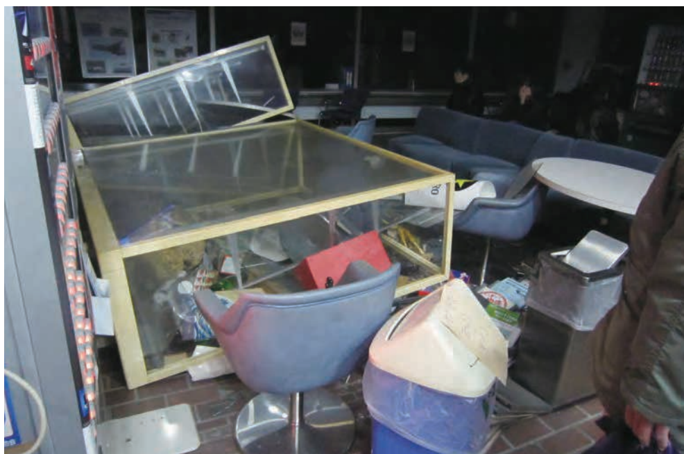
名取市役所ロビー