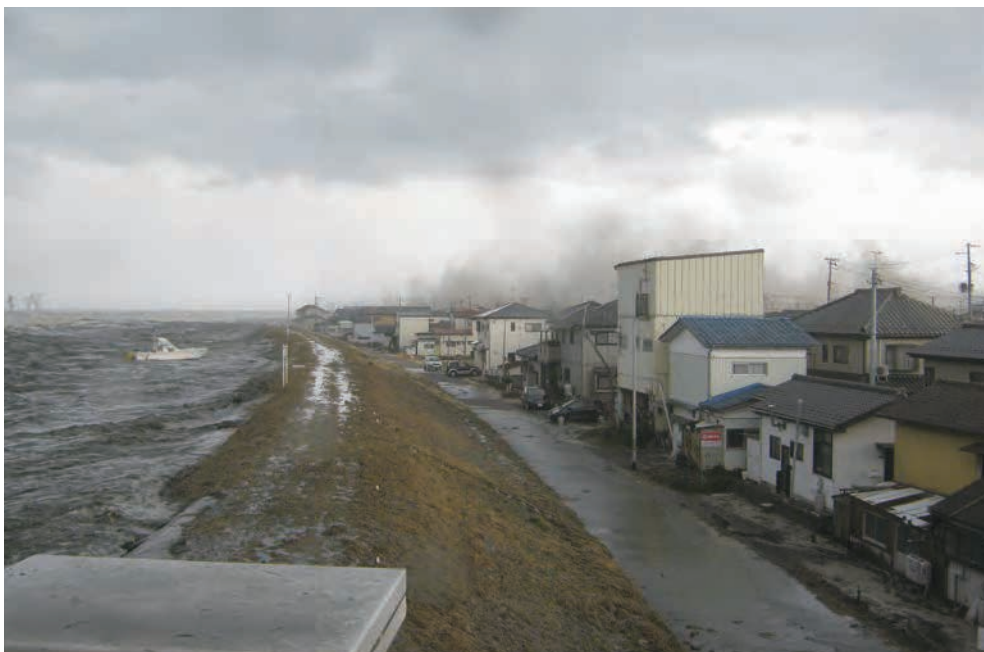
関上大橋から見た津波

津波を見た人の証言によく出てくる、津波による「黒い煙」を捉えた写真。当初は津波だとは思えなかったようだ。