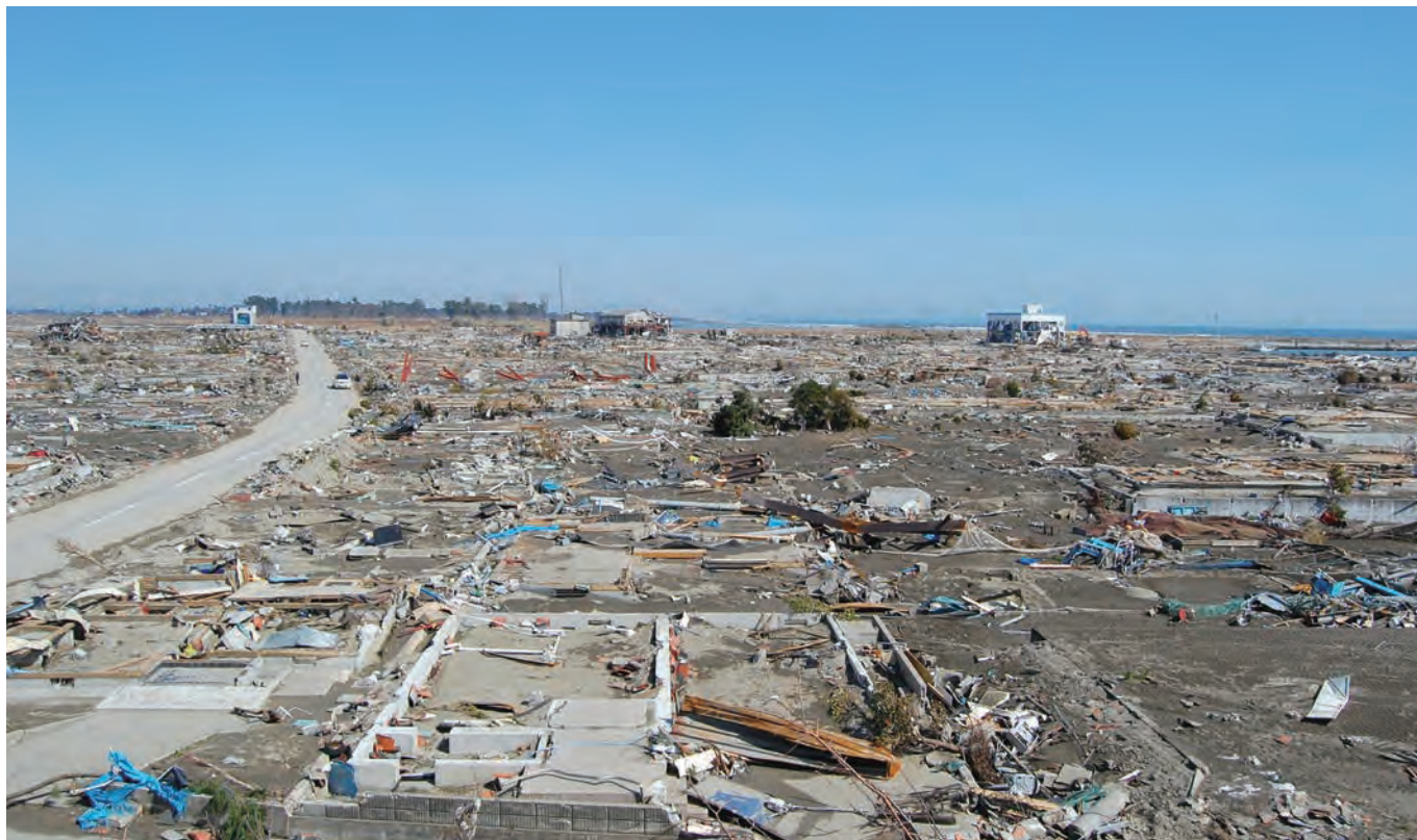
関上4丁目付近 日和山からみた住宅地跡 津波により家屋はほとんど流出し、家の基礎(コンクリート)のみが残った。