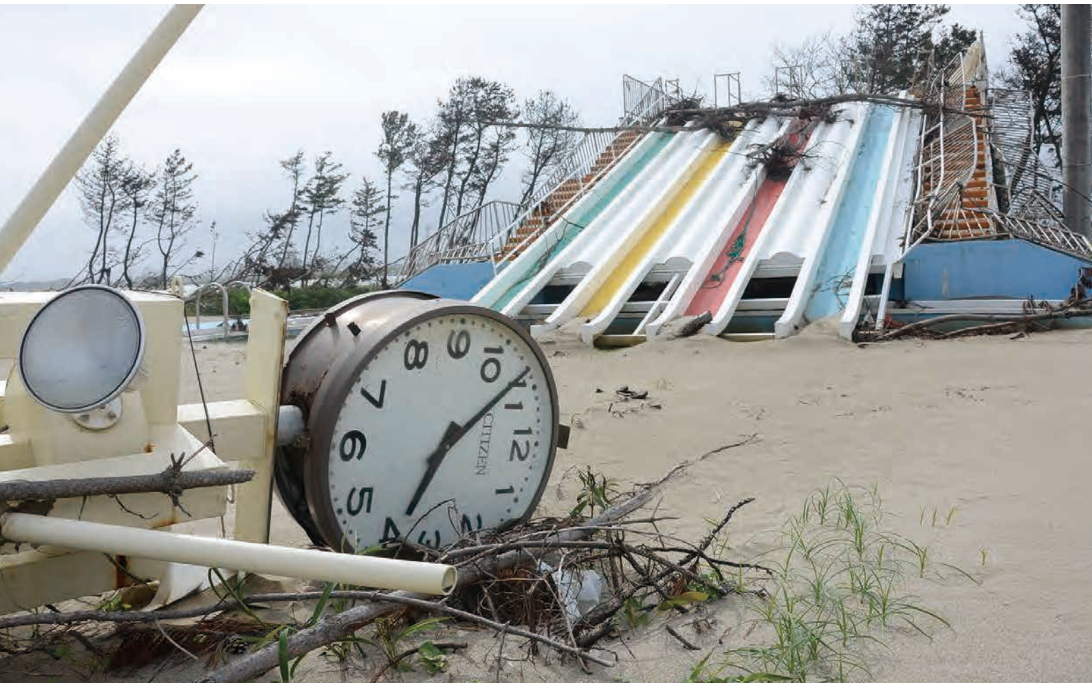
関上海浜プールの時計と滑り台 津波によって倒された「その時」を示している。