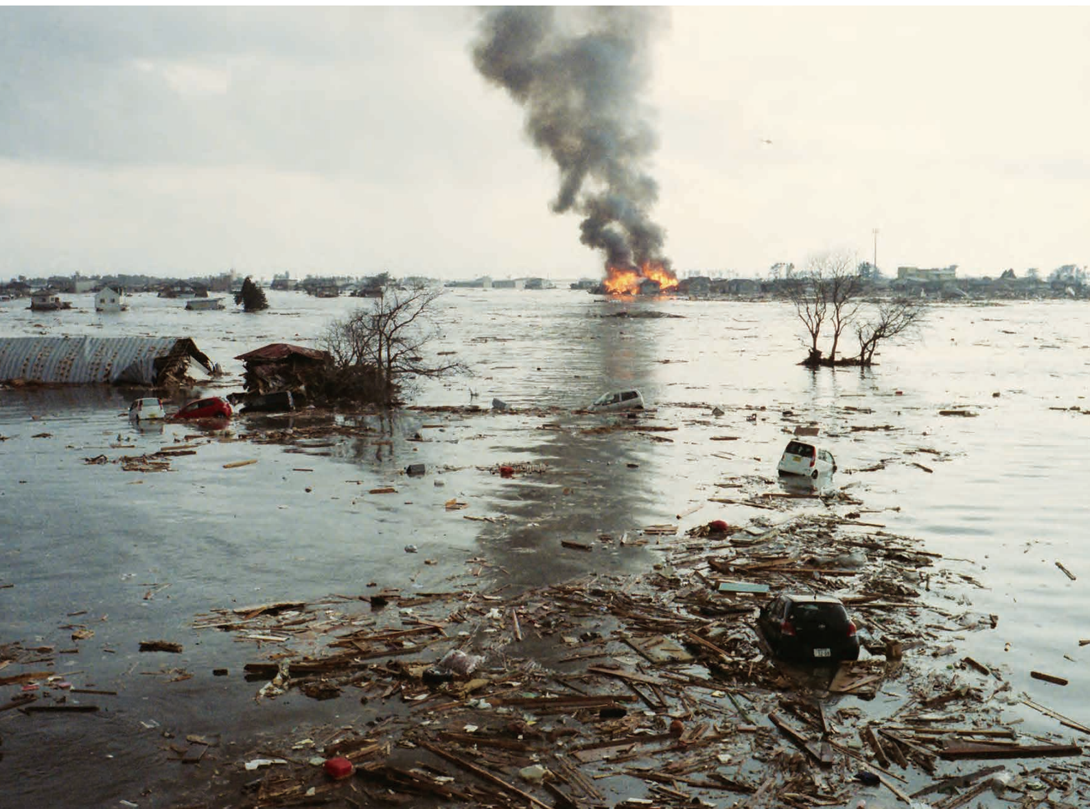
津波襲来と同時に火災も発生した。

津波により流されてきた乗用車の電気配線がショートして飛び散った火花が着火し、燃え上がった炎が家に接触して延焼拡大していったものや、燃えたがれきが流されてきて家に衝突し、延焼したと推定される。