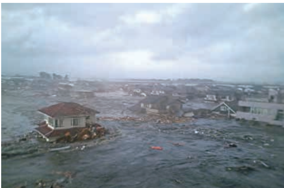
名取市消防署関上出張所付近から撮影