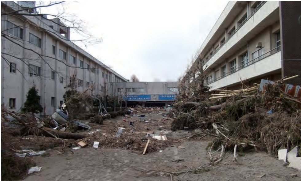
宮城県農業高等学校