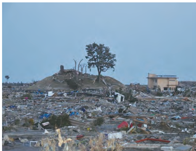
関上3丁目付近から見た日和山