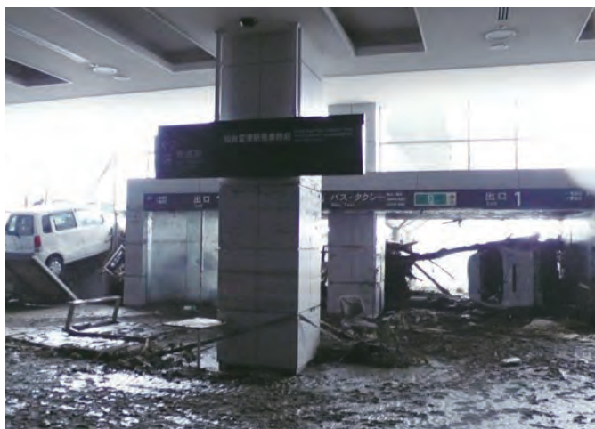
仙台空港ターミナルビル1階内部 ⑬2 平成23年3月16日 仙台空港ビル(株)