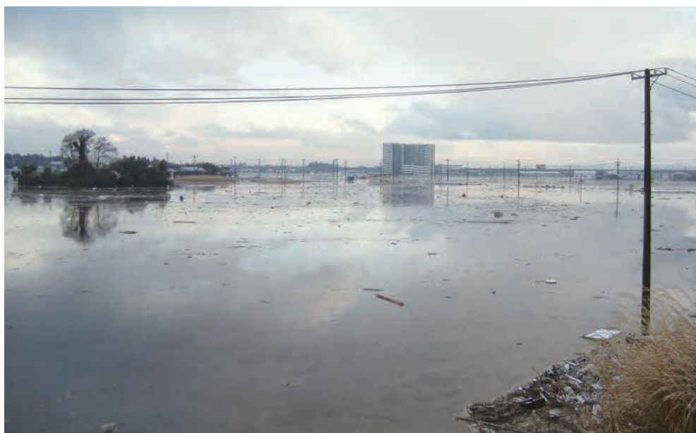
下増田地区内陸部