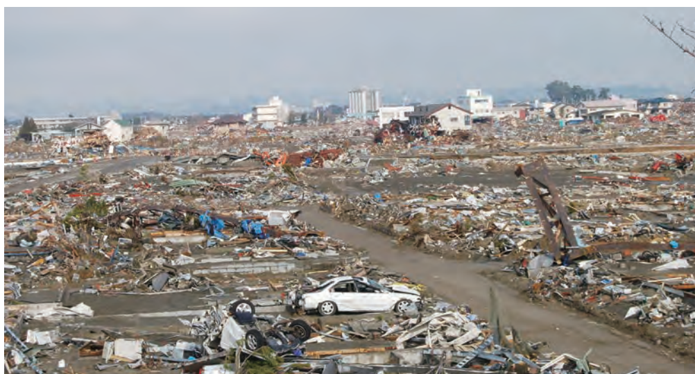
関上3丁目付近 日和山から見た住宅地跡