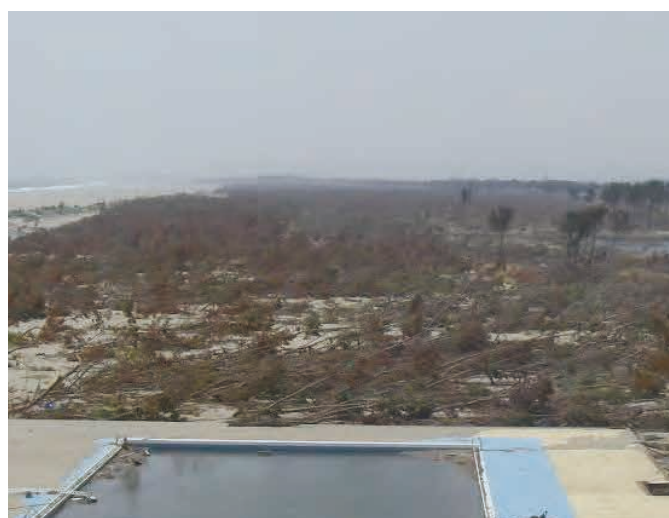
サイクルスポーツセンター屋上から撮影 防潮林のほとんどが津波により倒されている。 この後、生き残った木も塩害により一斉に枯れてしまった。