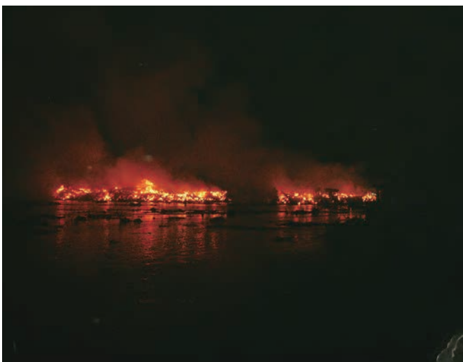
火災は夜も続いた。