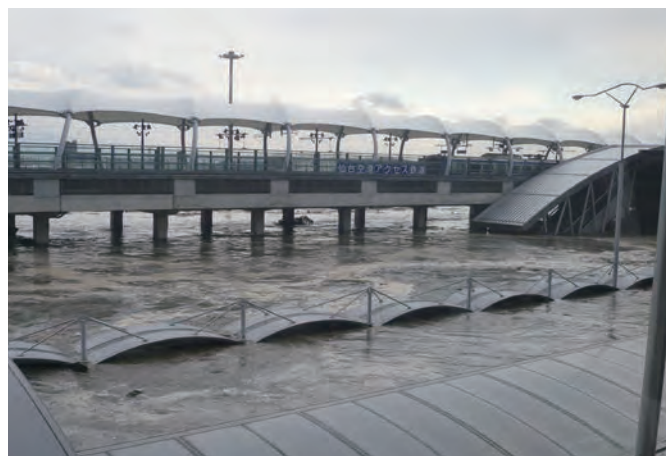
仙台空港アクセス鉄道の仙台空港駅 電車が停車している。