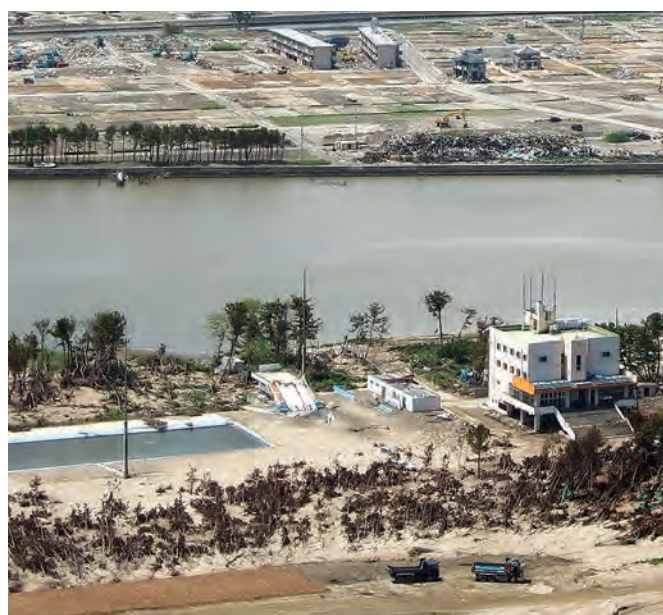
サイクルスポーツセンターと関上海浜プール 65 日付不明 松木良夫