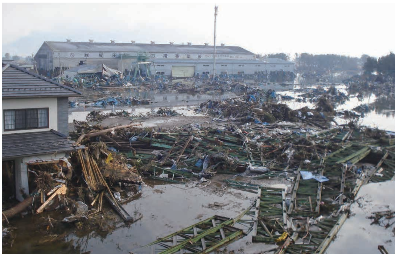
広浦地区 ⑬4 平成23年3月12日 (株)オイルプラントナトリ