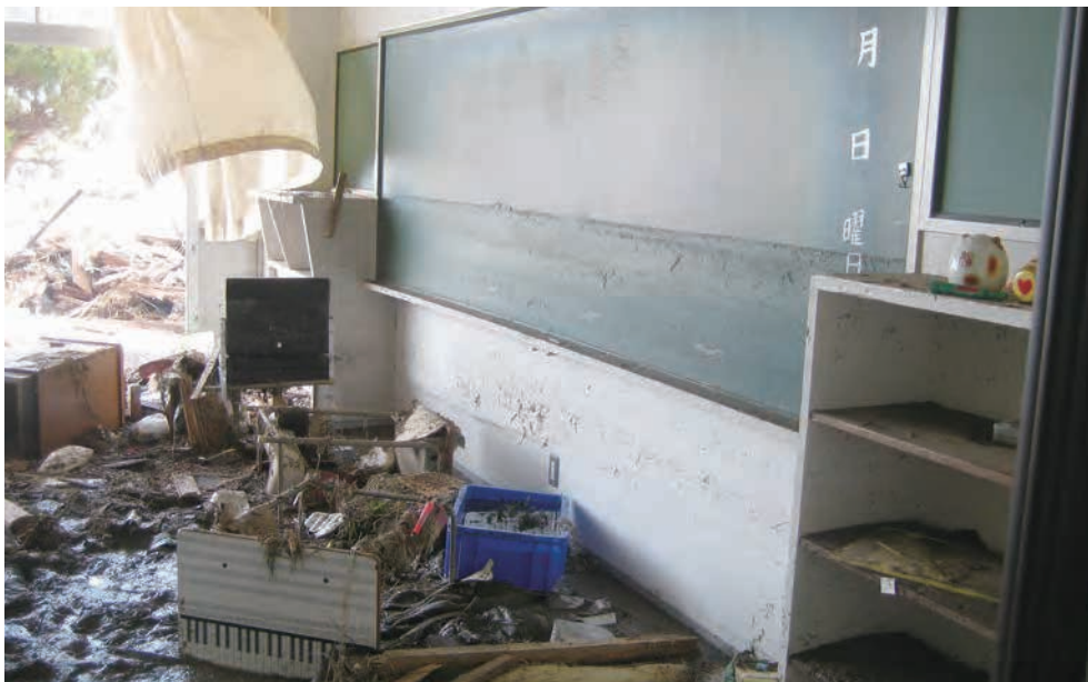
関上中学校1階教室内 黒板に津波の跡が残る。