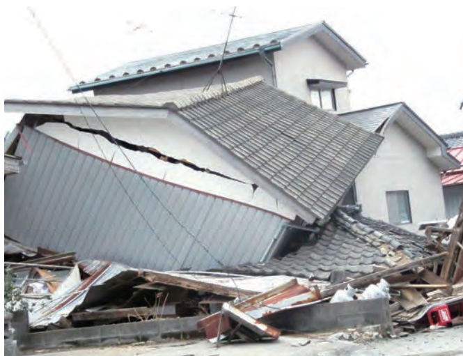
開上の倒壊した家屋、その後津波が襲来した。