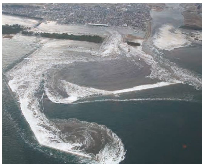
関上港に流入する津波