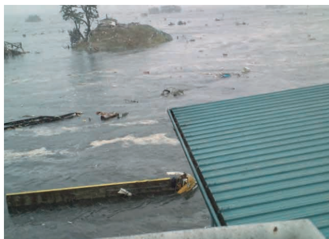
関上5丁目から撮影 奥に見えるのが関上の「日和山」