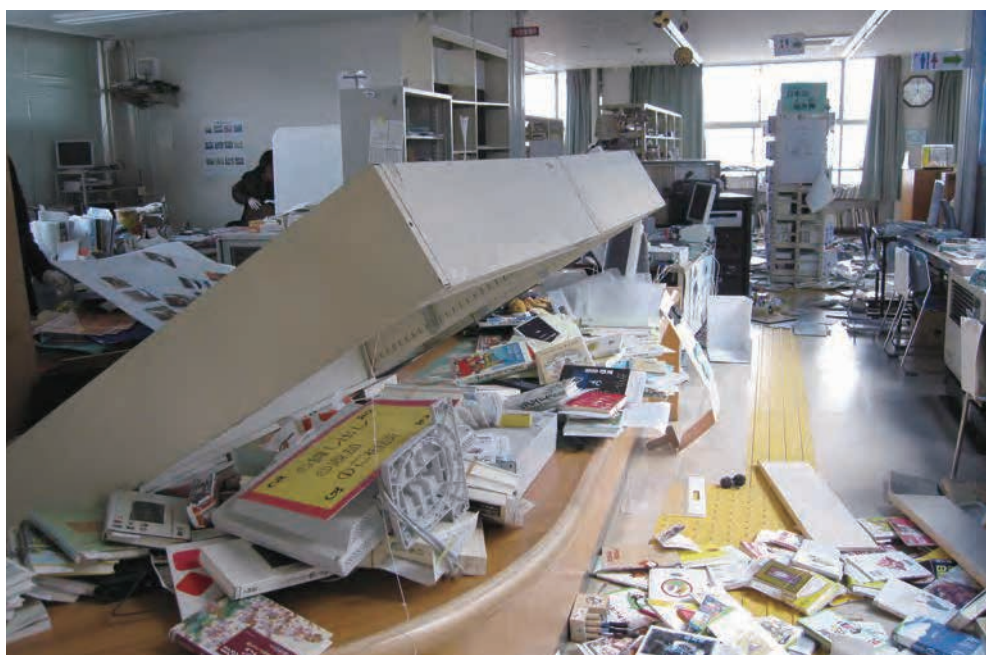
名取市図書館のカウンター付近

市図書館・増田公民館・市民活動支援センターは、建物が古かったこともあり地震動の被害が大きく、使用不能となった。