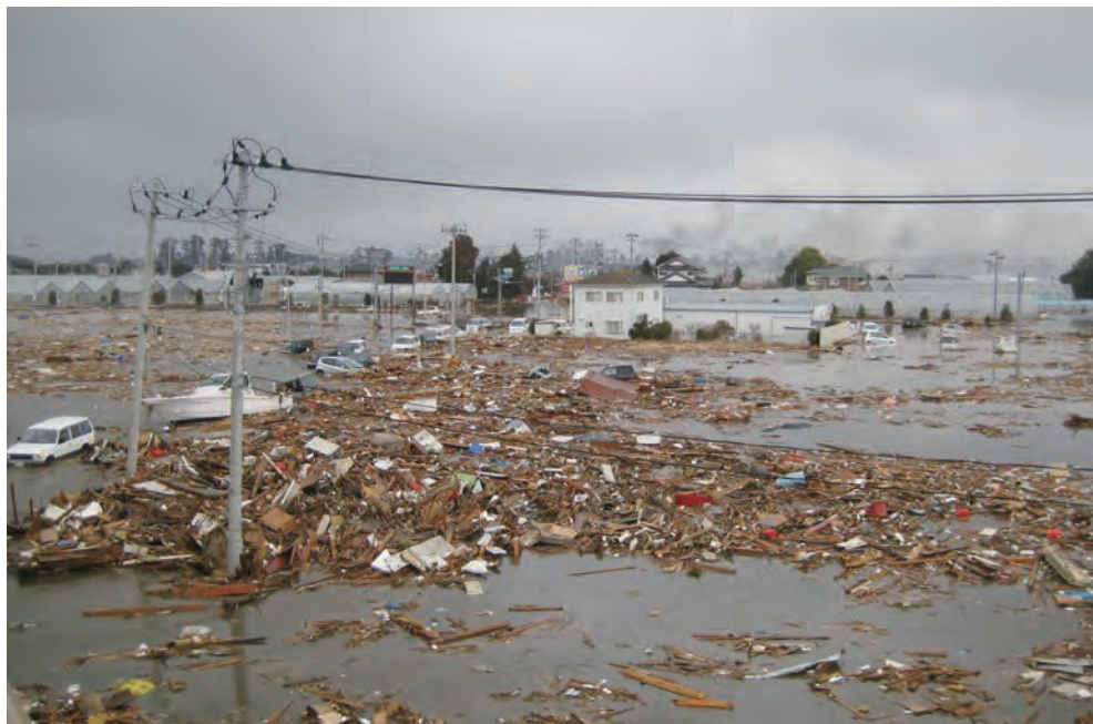
仙台東部道路(高速道路)まで 押し寄せた津波