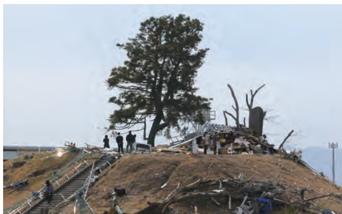
日和山 標高6.3m、海岸からの距離は約800m、山の頂上から2.1m上まで浸水した痕跡が残っていた。頂上に民家の屋根が流れ着いている。