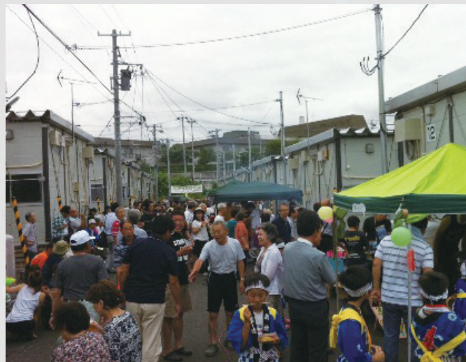
仮設住宅箱塚桜団地の夏まつり 289 平成23年8月19日 名取市