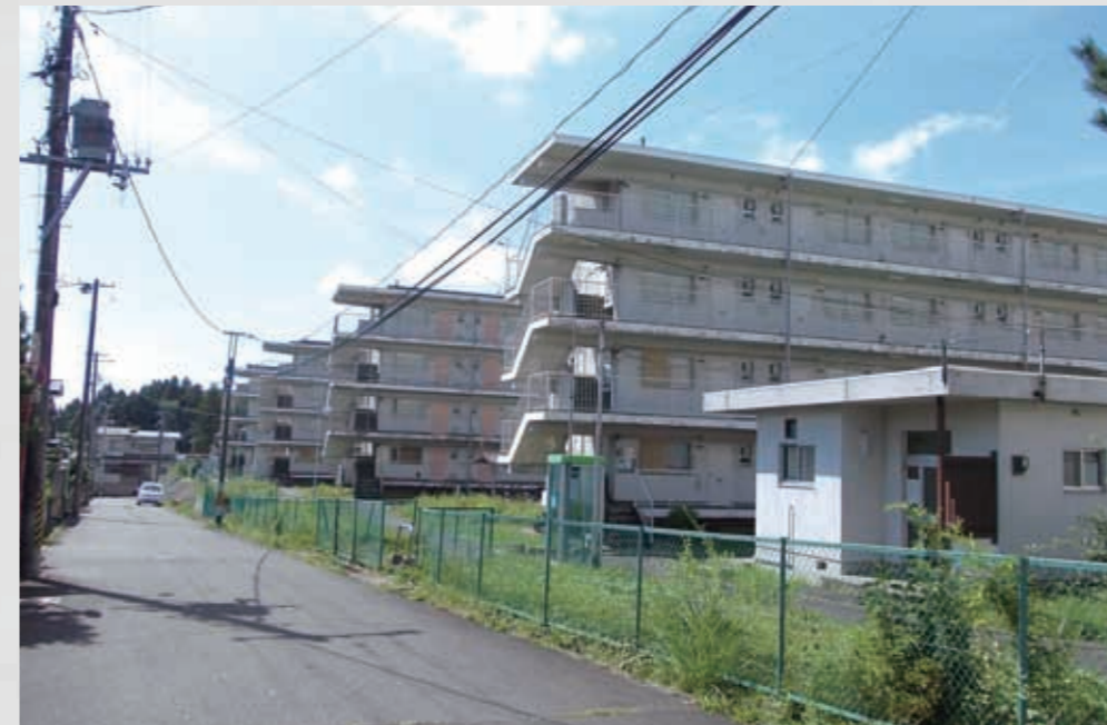
雇用促進住宅も仮設住宅に充てられた。