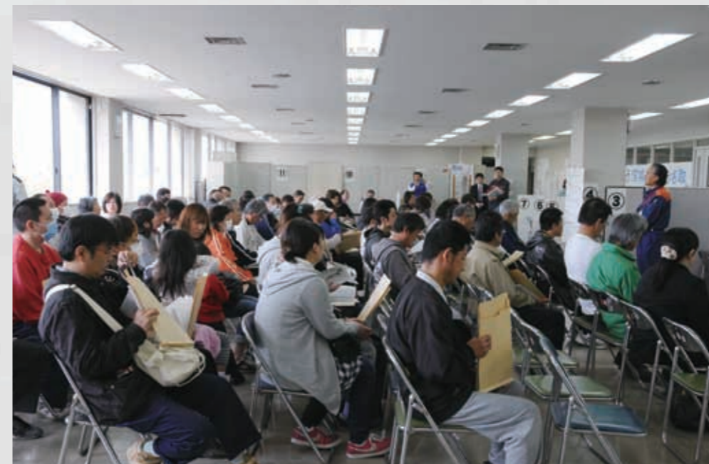
仮設住宅の入居説明会