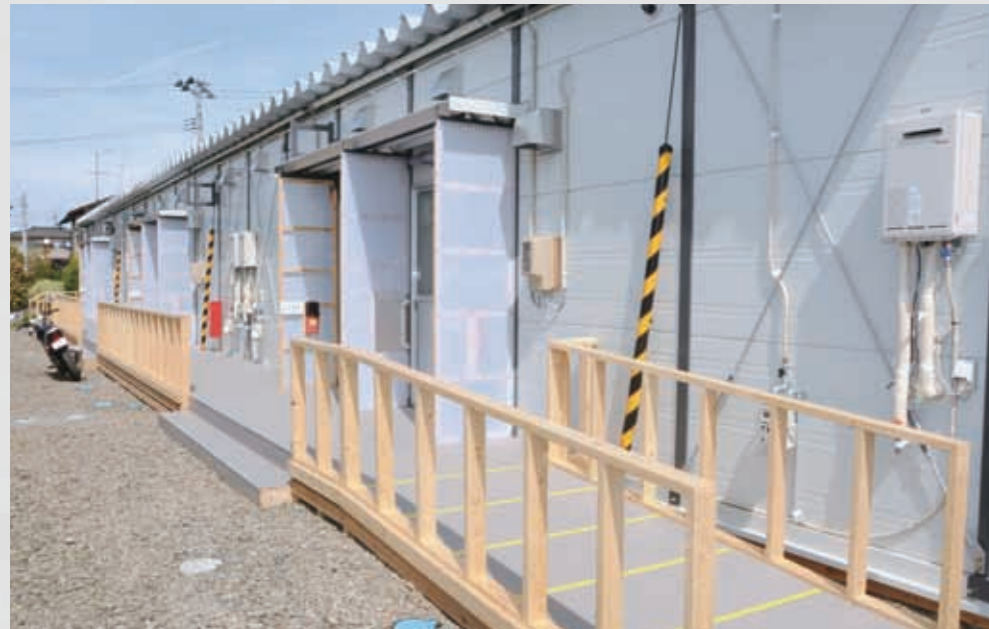
277 平成23年5月3日 名取市