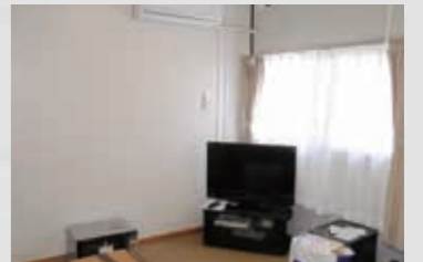
285 平成23年5月3日 名取市