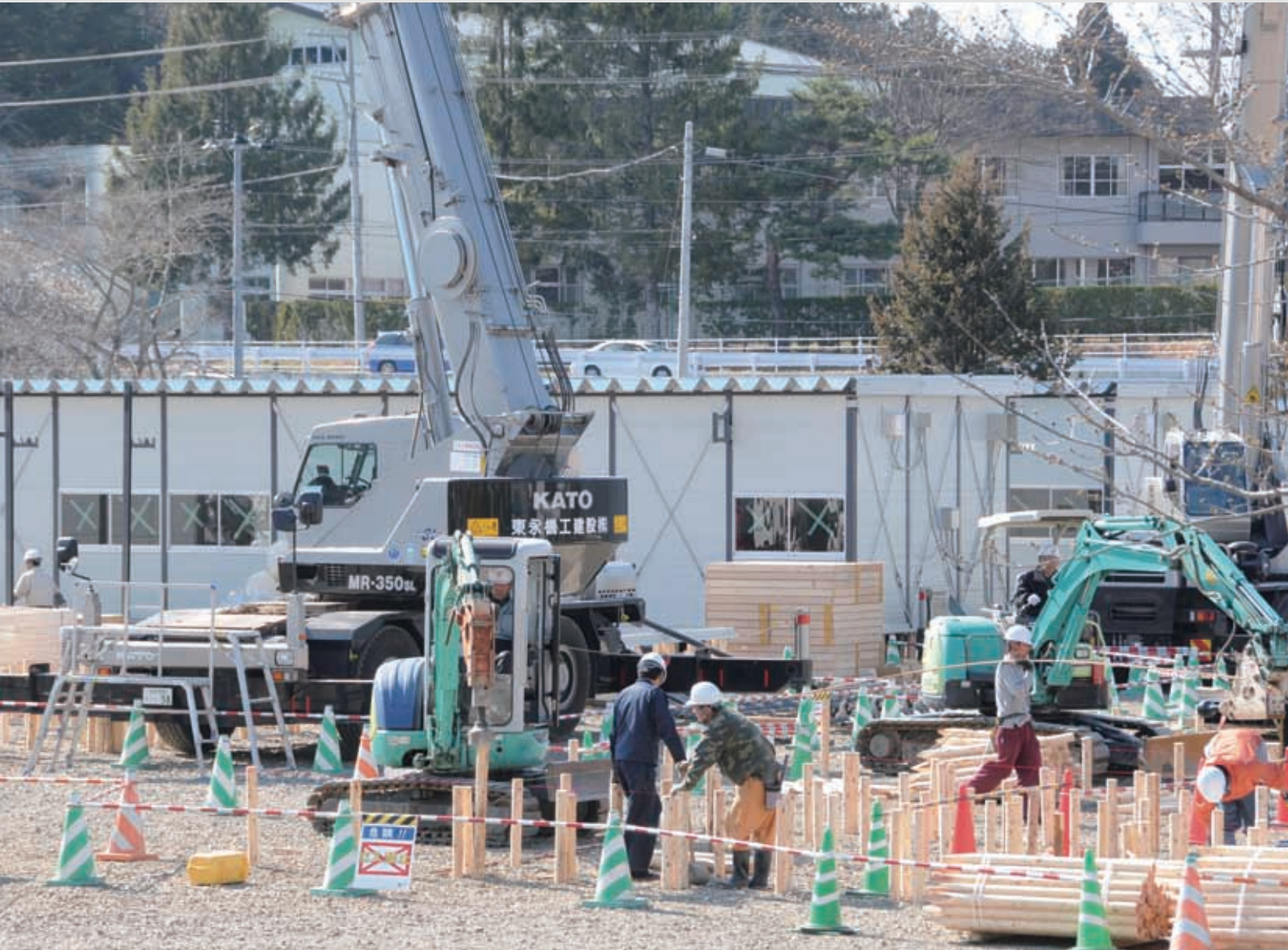
応急仮設住宅の建設

名取市では、7カ所の応急仮設住宅団地が建てられ、その他雇用促進住宅や民間賃貸借り上げ住宅(みなし仮設住宅)なども仮設住宅として充てられた。