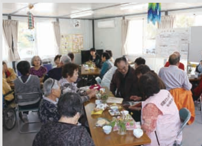
仮設住宅集会所では、様々な催しが行われている。