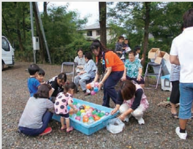
仮設住宅箱塚屋敷団地の夏まつり 288 平成23年8月23日 名取市