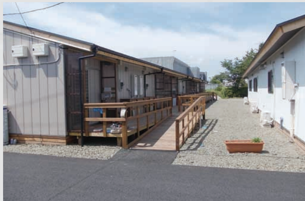
282 平成23年8月30日 名取市