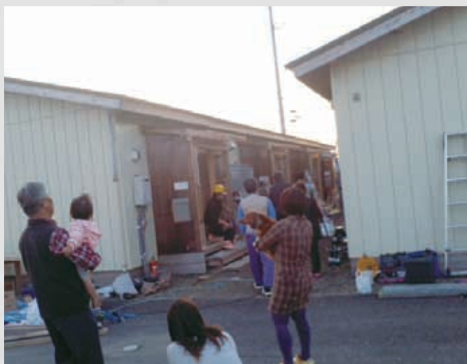
風除室の取り付け工事 290 平成23年11月1日 名取市