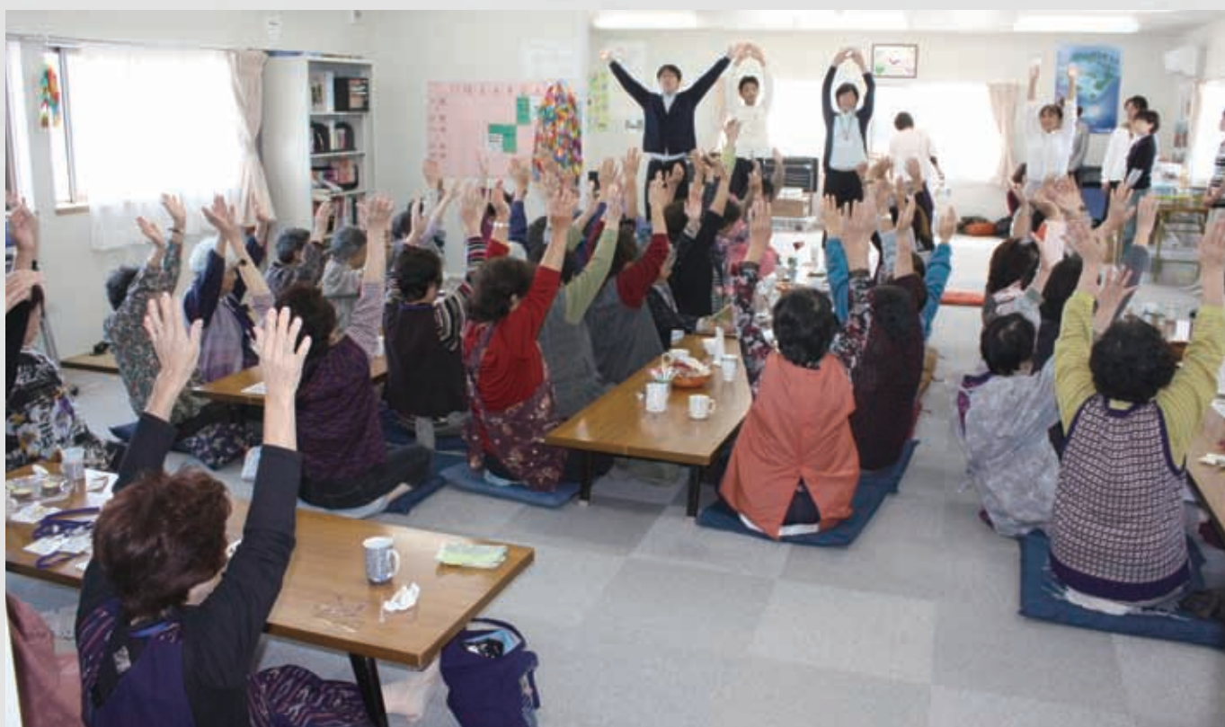
292 平成23年10月7日 名取市社会福祉協議会