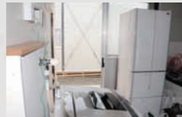
281 平成23年5月3日 名取市