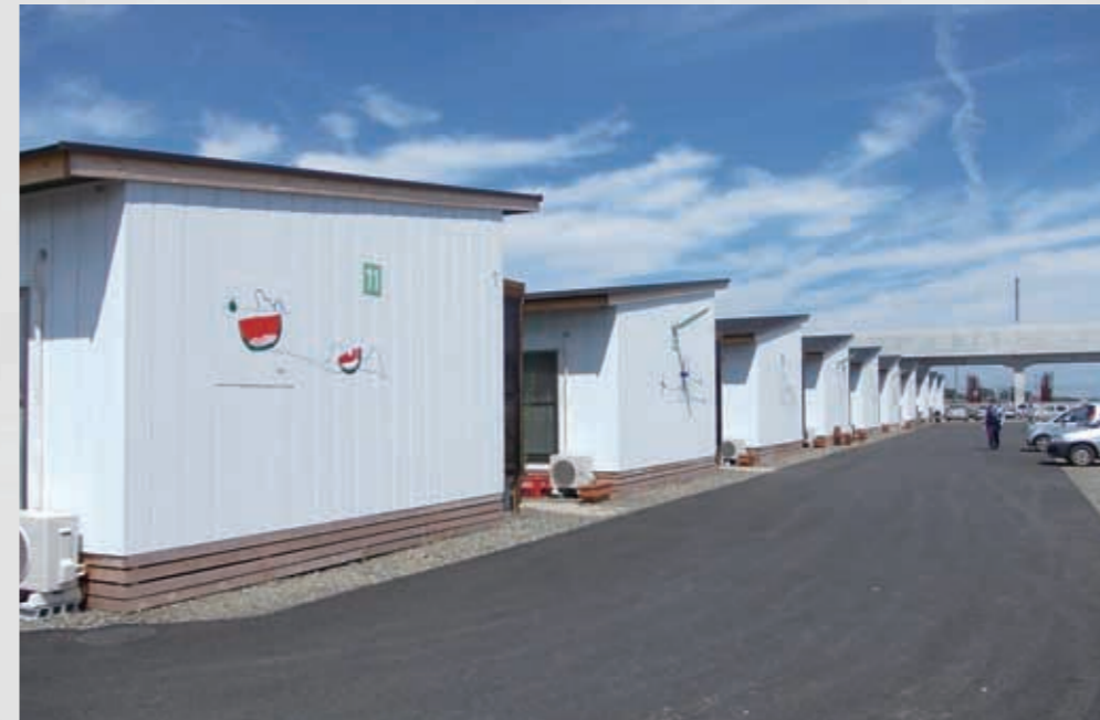
284 平成23年8月30日 名取市