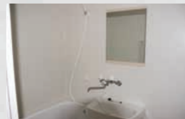
283 平成23年5月3日 名取市