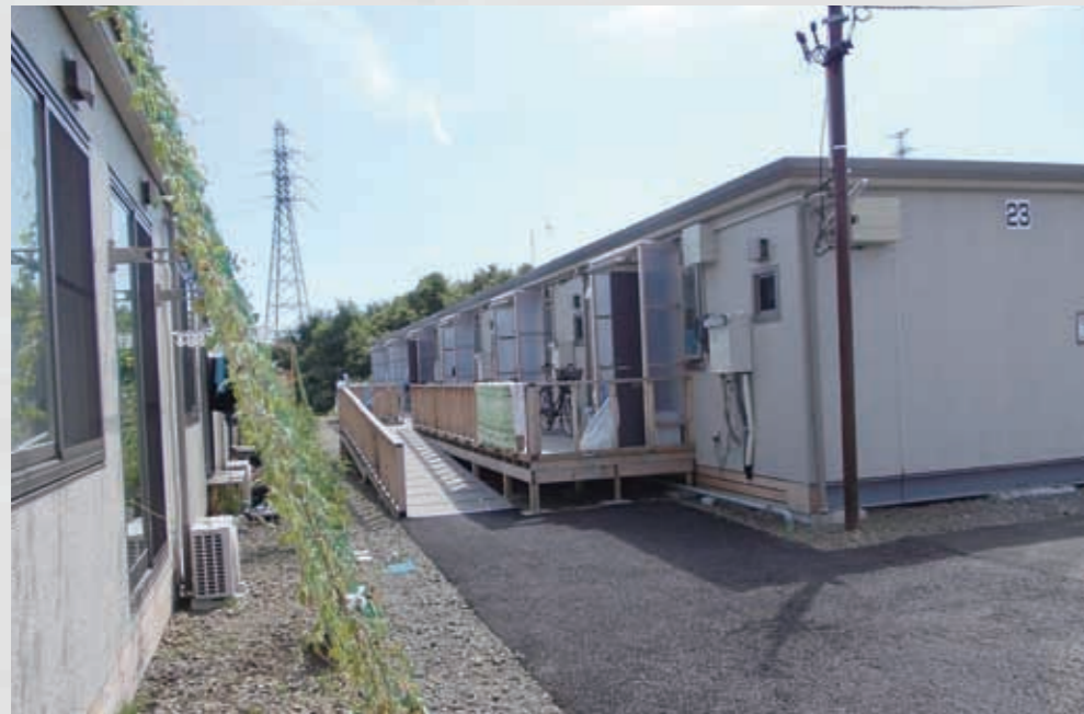
280 平成23年8月30日 名取市