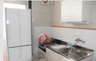
279 平成23年5月3日 名取市