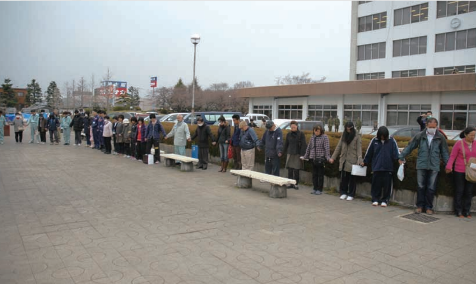
震災から1カ月目 市役所前広場で市民と市職員らが手をつなぎ、慰霊のための黙祷を行った。 215 平成23年4月11日 名取市

震災1カ月目、100日目、お盆、1年目などの節目に、名取市や民間による慰霊行事が数多く執り行われた。残された者たちは、亡くなられた方々のご冥福をただ祈るばかりであった。