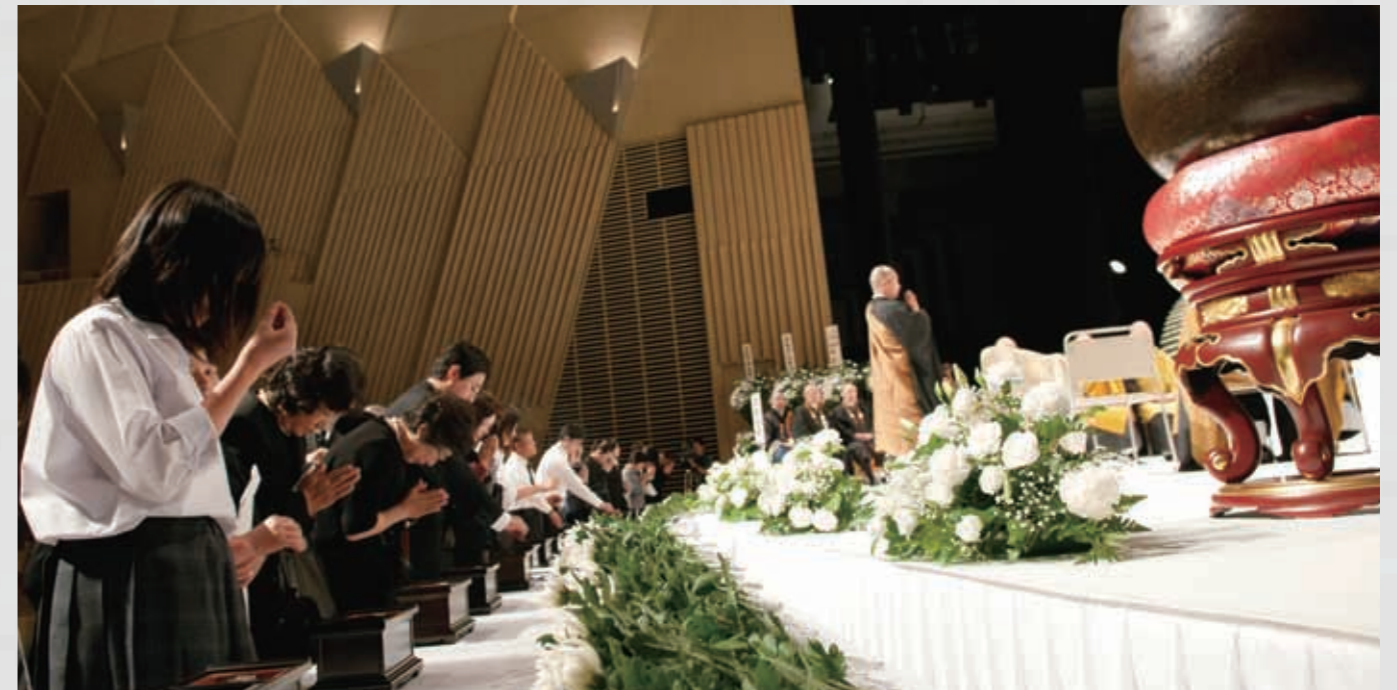
217 平成23年6月18日 名取市