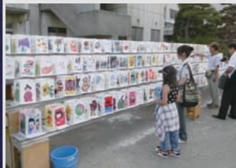
223 平成23年8月13日 (株)ペナントコーポレーション