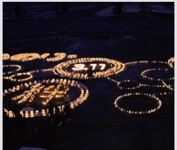
231 平成24年3月11日 名取市物産観光協会