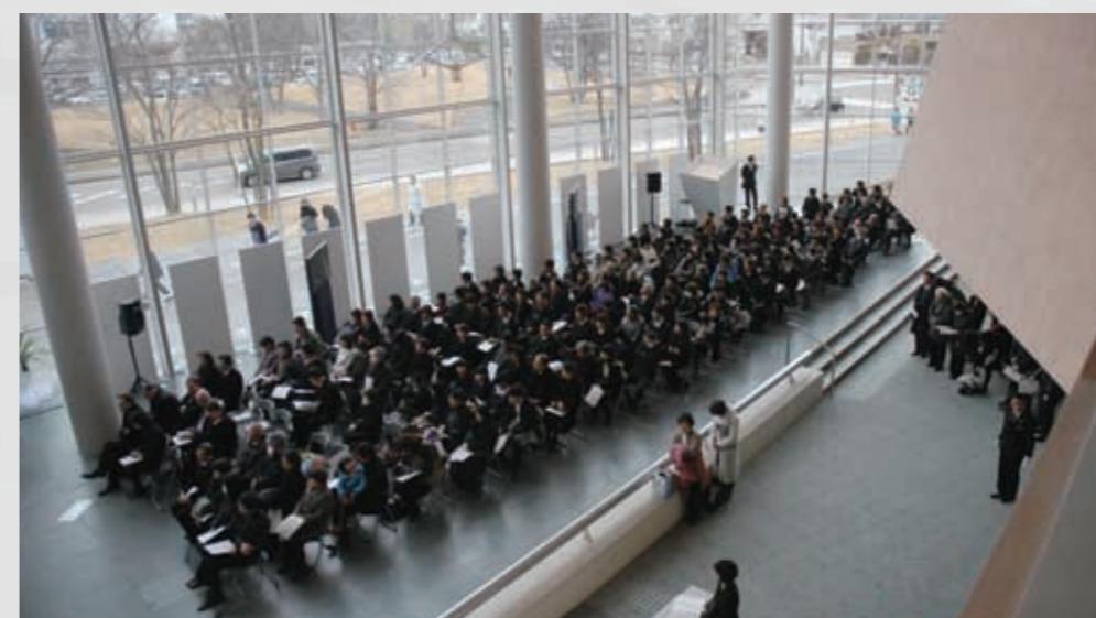
227 平成24年3月11日 名取市