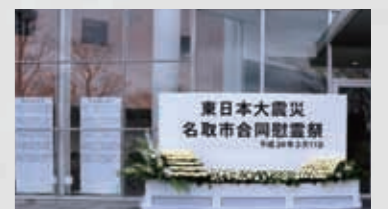
225 平成24年3月11日 名取市