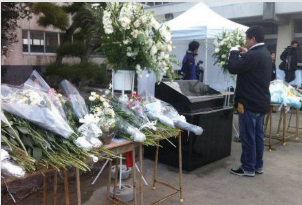
関上中学校遺族会が建立した慰霊碑