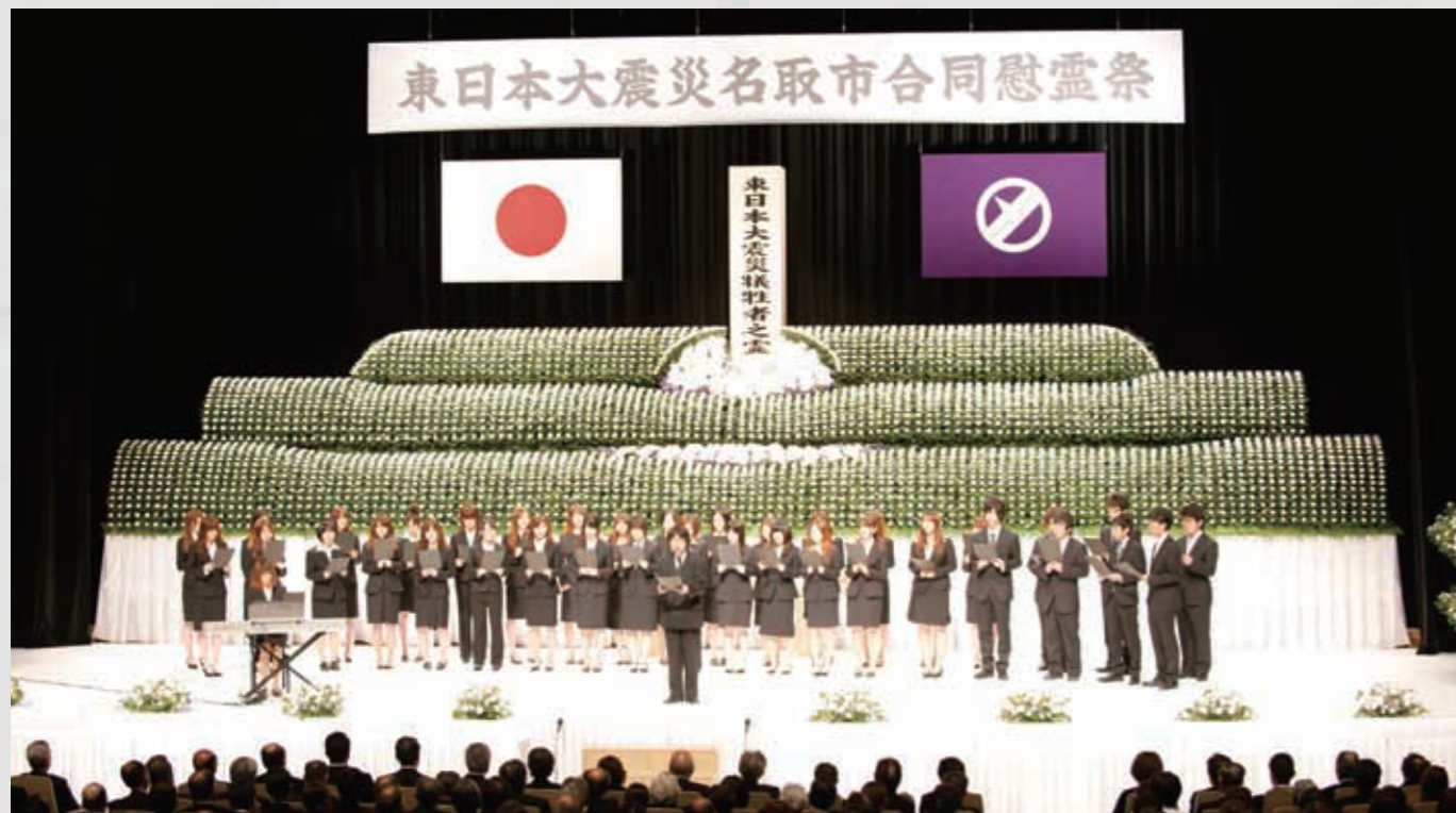
名取市合同慰霊祭 震災から100日目。会場は文化会館。写真は、大ホールの様子だが小・中ホールや大ホール前のスペースにも席が設けられ、大勢の方々が冥福を祈った。 218 平成23年6月18日 名取市