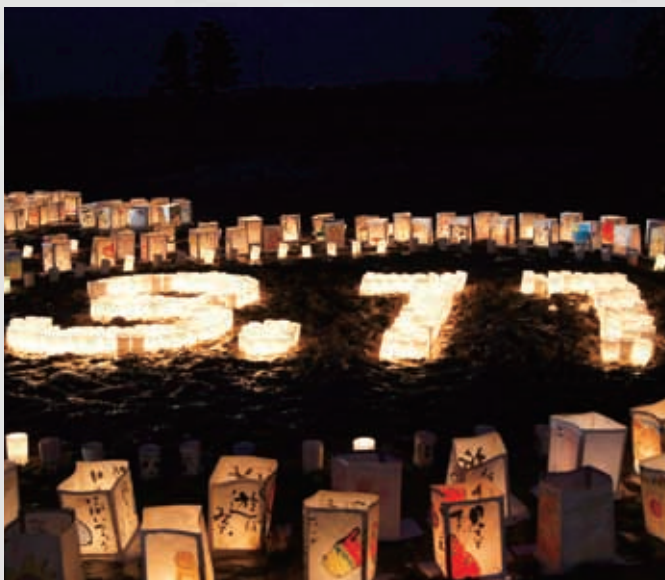
3.11ゆりあげの集い 230 平成24年3月11日 名取市物産観光協会