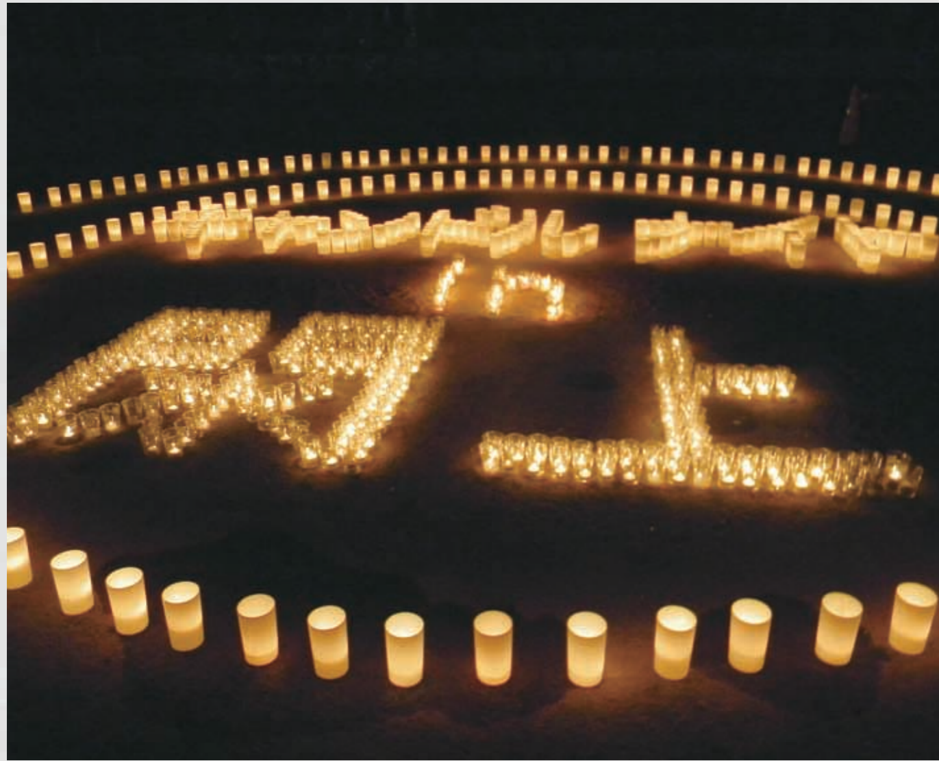
キャンドルナイト in 閉上