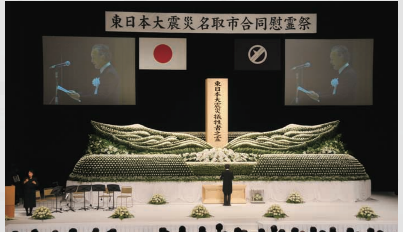
名取市合同慰霊祭 震災から1年目。会場は文化会館。