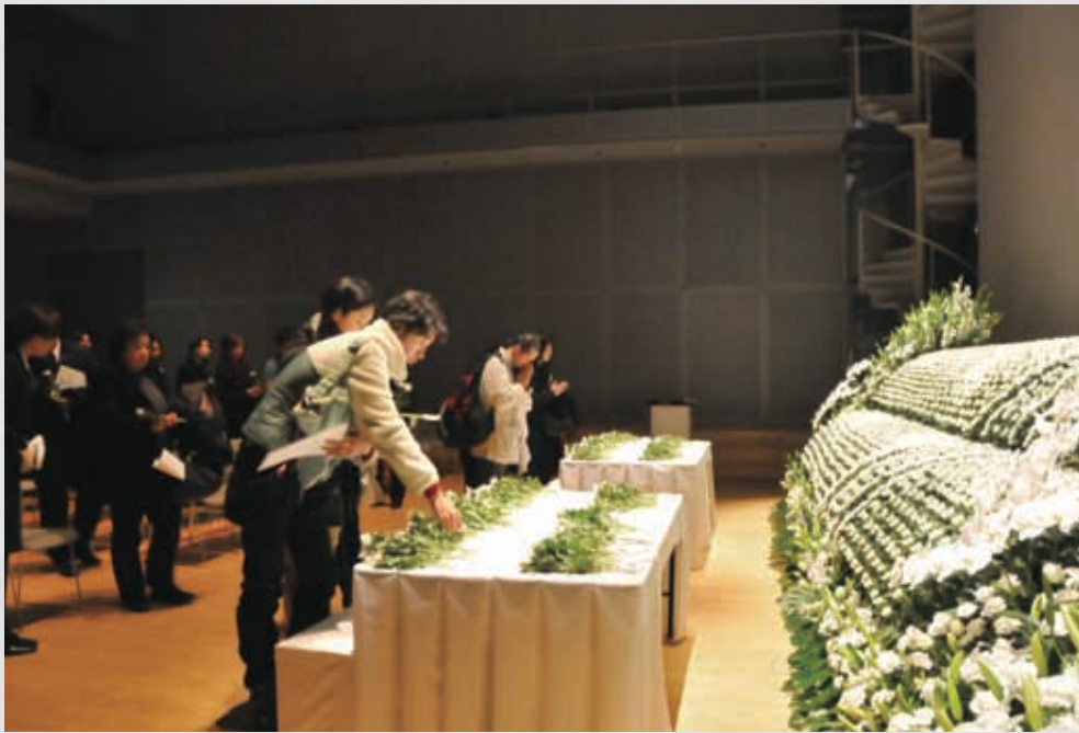
228 平成24年3月11日 名取市