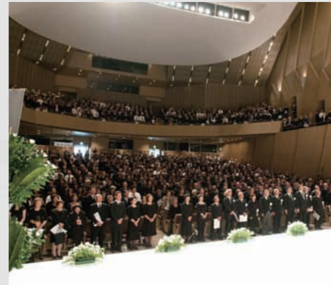
215 平成23年6月18日 名取市