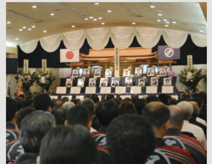
消防職団員殉職者合同慰霊祭 219 平成23年7月18日 名取市消防本部