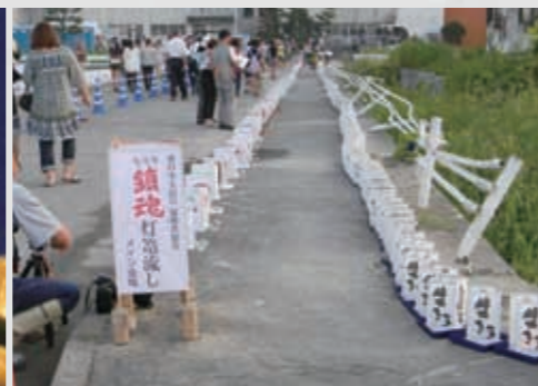
222 平成23年8月13日 (株)ペナントコーポレーション