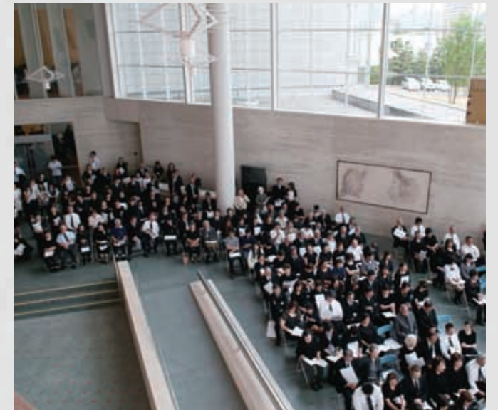
216 平成23年6月18日 名取市