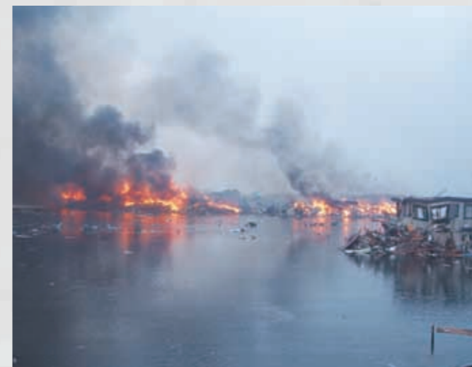
148 平成23年3月11日 松本康裕