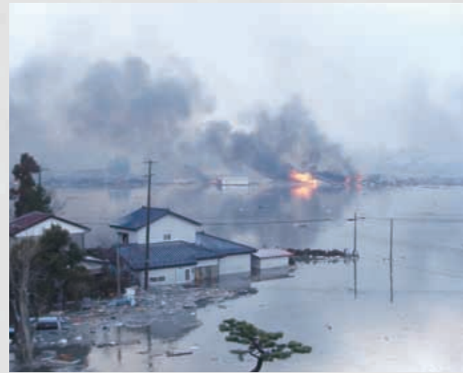
146 平成23年3月11日 池田良