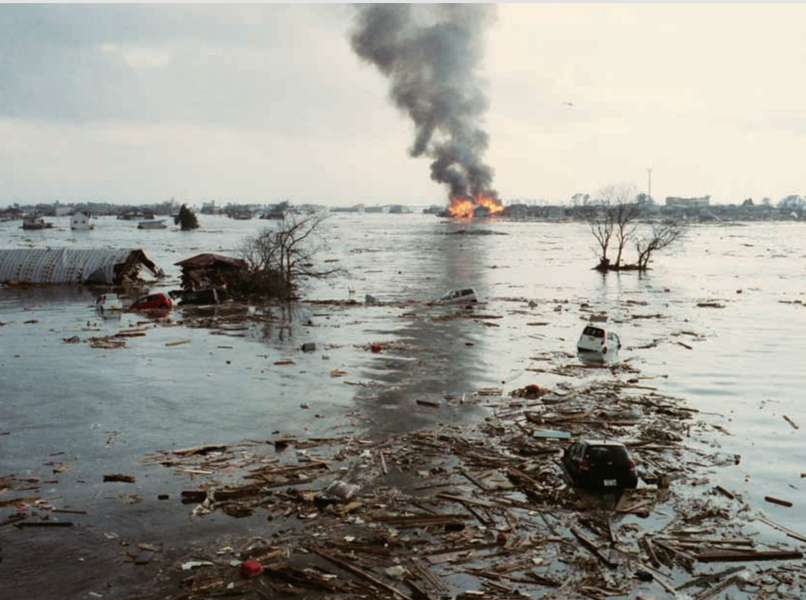
津波襲来と同時に火災も発生した。

火災の原因は、津波で流されてきたがれきや車両からの出火であった。 津波により流されてきた乗用車の電気配線がショートして飛び散った火花が着火し、燃え上がった炎が家に接触して延焼拡大していったものや、燃えたがれきが流されてきて家に衝突し、延焼したと推定される。