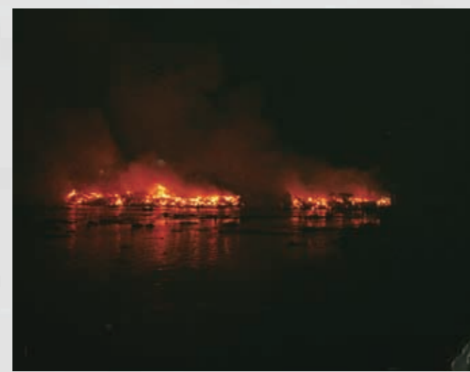
火災は夜も続いた。