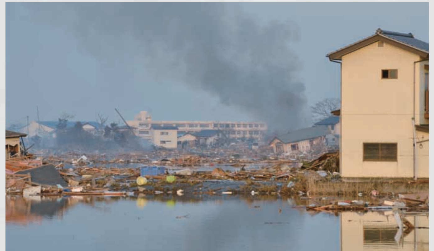
147 平成23年3月13日 東光彦