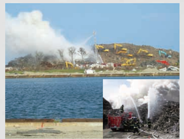
がれき置き場で発生した火災 平成23年9月16日 151 名取市(大)・152 名取市消防本部(小)