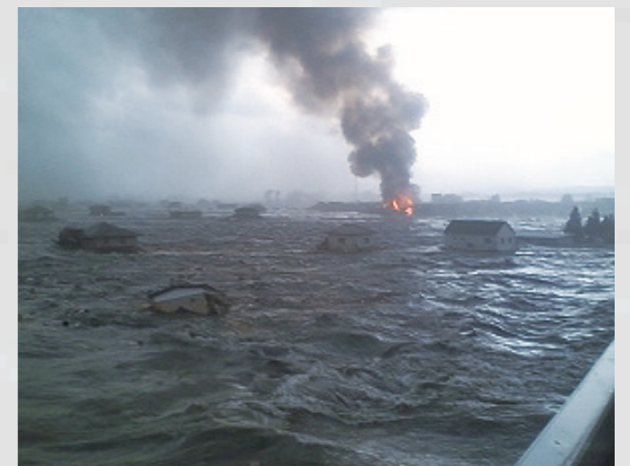
149 平成23年3月11日 金矢泰弘