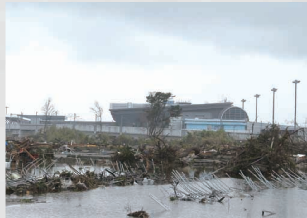
125 平成23年3月25日 名取市