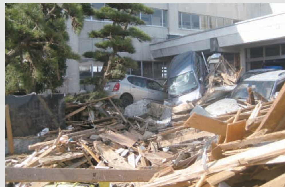
関上中学校昇降口付近