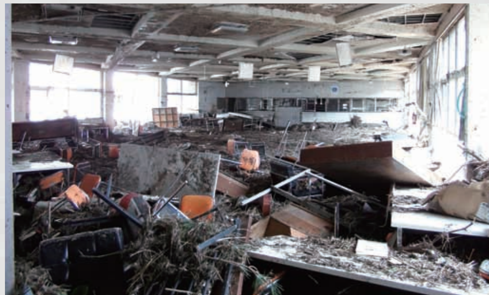
137 平成23年3月11日 宮城県農業高等学校 宮城県農業高等学校内部 136 平成23年3月30日 宮城県農業高等学校