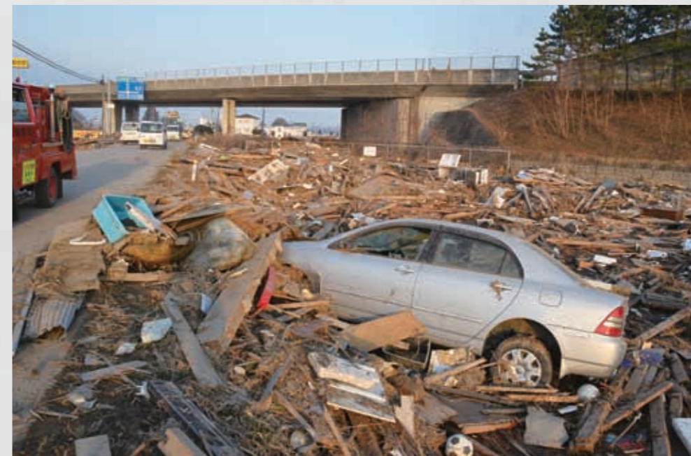
仙台東部道路西側 「関上街道」との交差・開口部 ⑫ 平成23年3月13日 東光彦