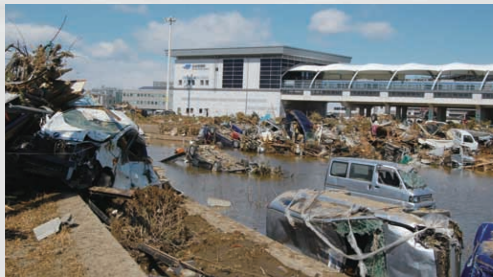
仙台空港アクセス鉄道の 仙台空港駅