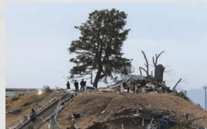
日和山 標高6.3m、海岸からの距離は約800m、山の頂上から2.1m上まで浸水した痕跡が残っていた。頂上に民家の屋根が流れ着いている。 73 平成23年4月2日 名取市