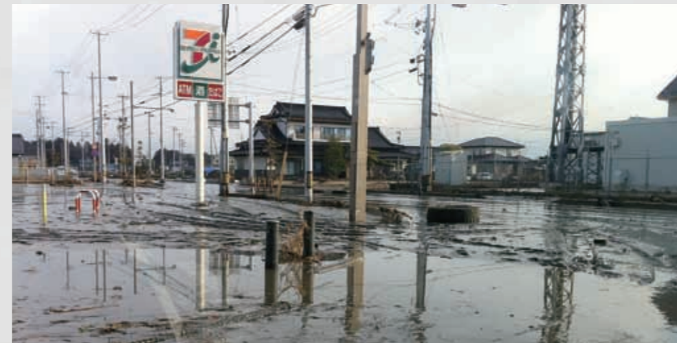
139 平成23年3月13日 名取市