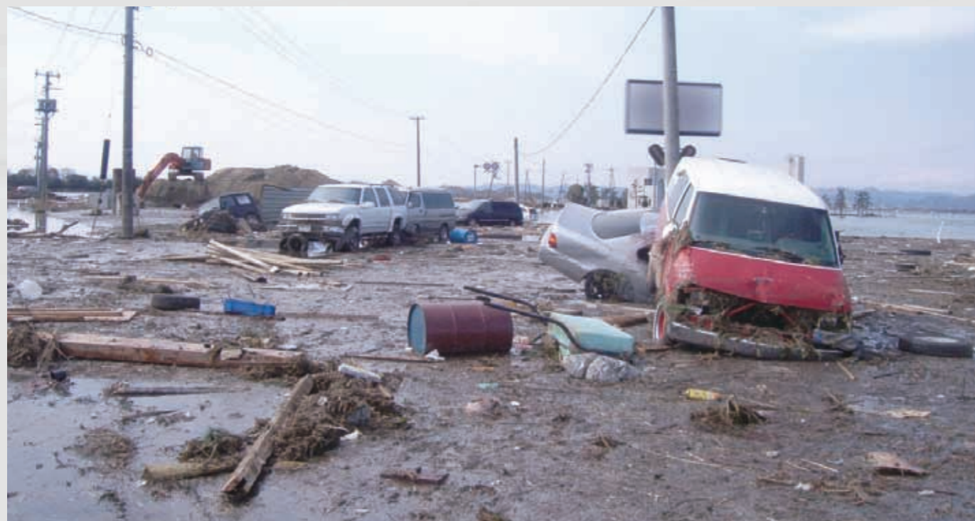
杉ヶ袋地区 県道「塩釜-亘理線」 県南部の海岸沿いを走る主要な県道。電柱の間が道路。 138 平成23年3月13日 (株)ワタケン