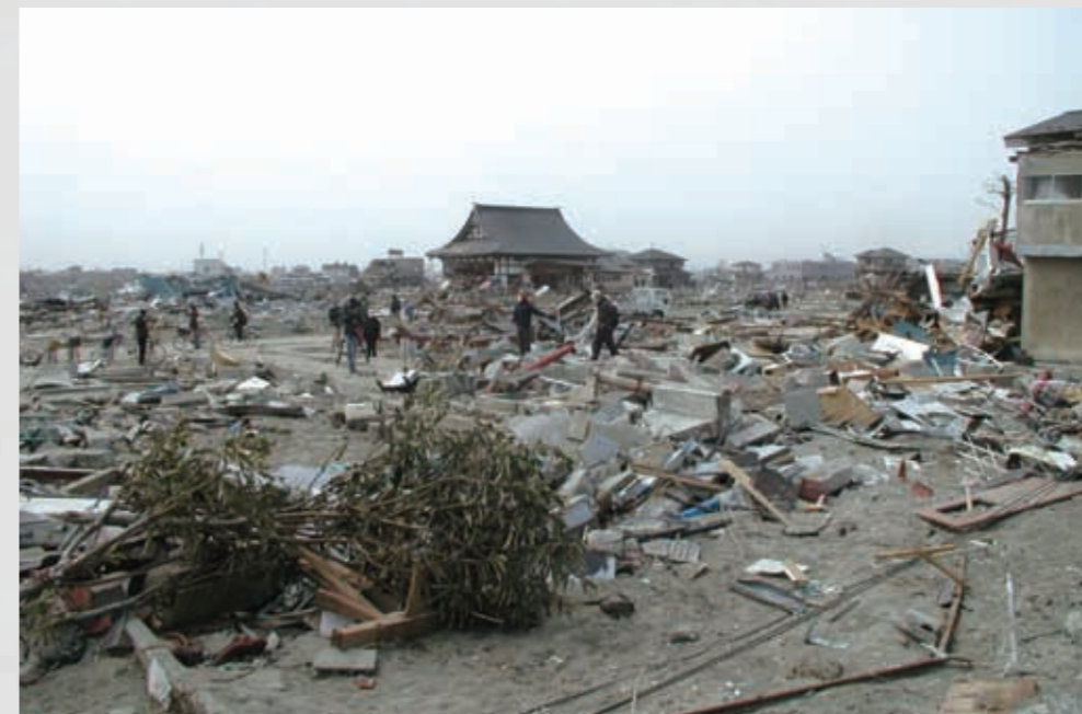
閑上2丁目付近 中央奥には東禅寺が見える。 89 平成23年3月20日 橋浦精麦倉庫(株)