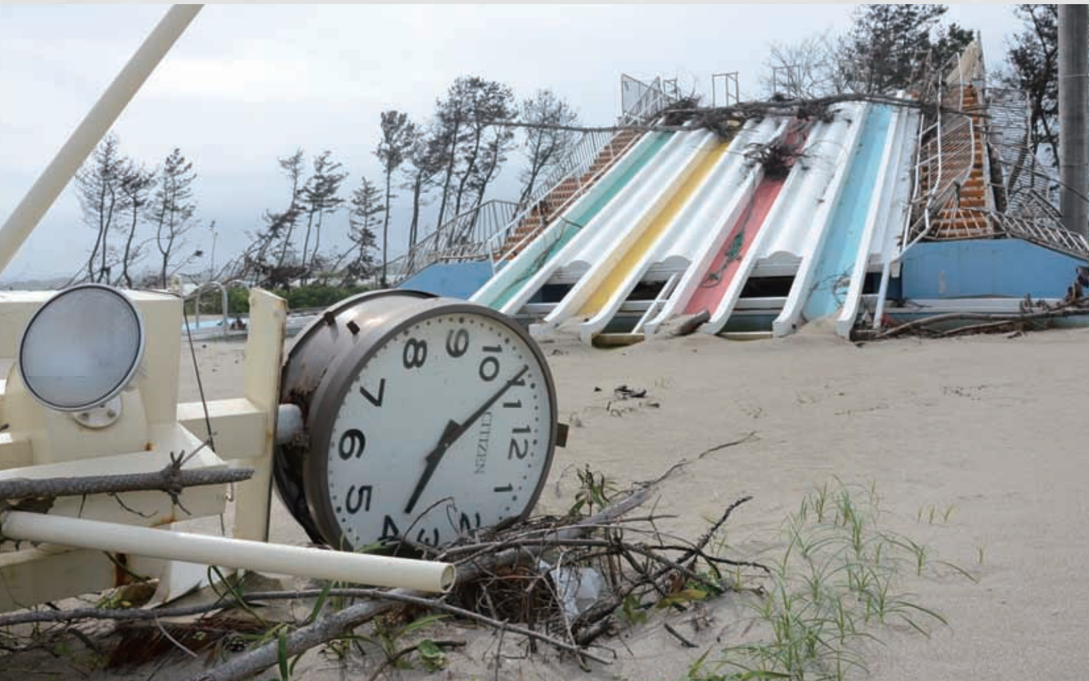
関上海浜プールの時計と滑り台 津波によって倒された「その時」を示している。