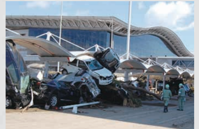
仙台空港ターミナルビル前