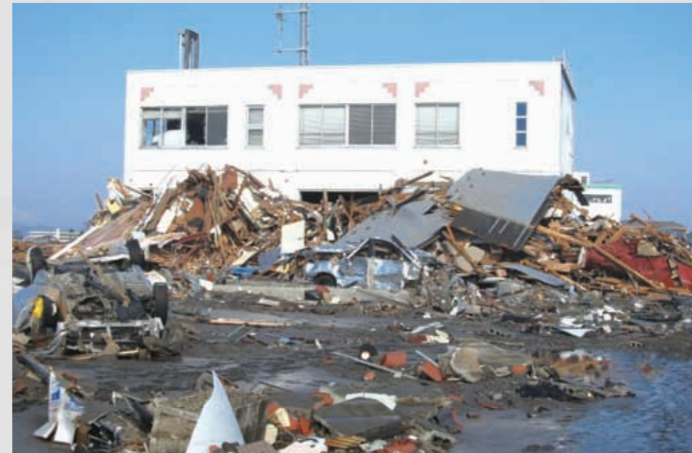
名取市消防署関上出張所