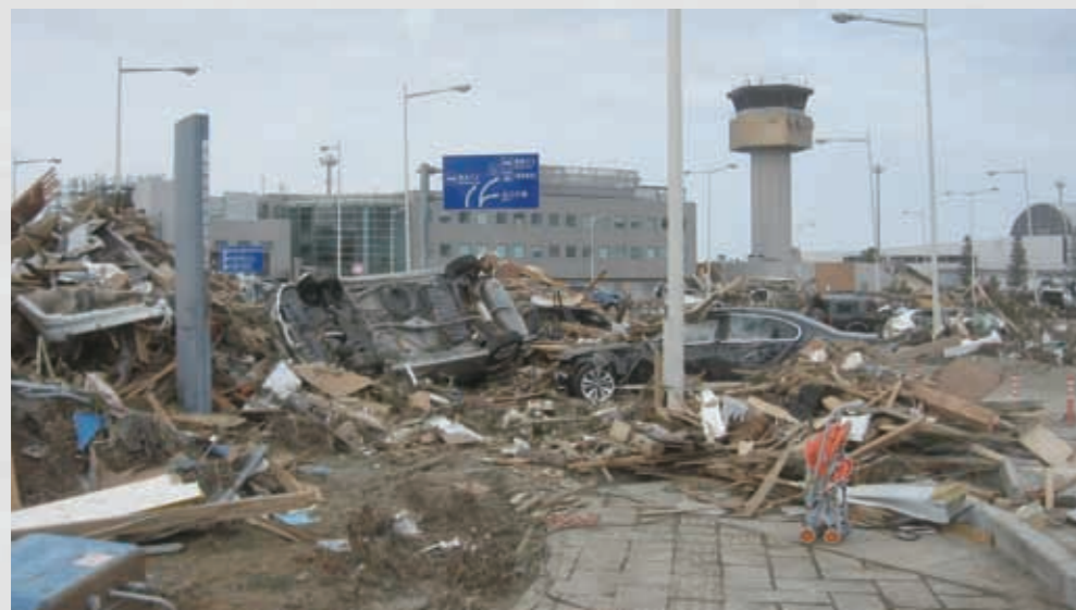
仙台空港 高い建物が管制塔