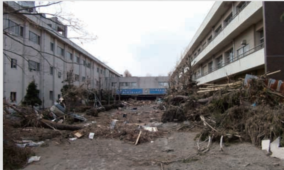
宮城県農業高等学校 135 平成23年3月30日 宮城県農業高等学校