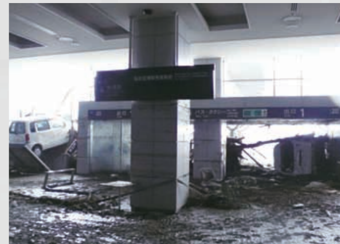
仙台空港ターミナルビル1階内部 132 平成23年3月16日 仙台空港ビル(株)