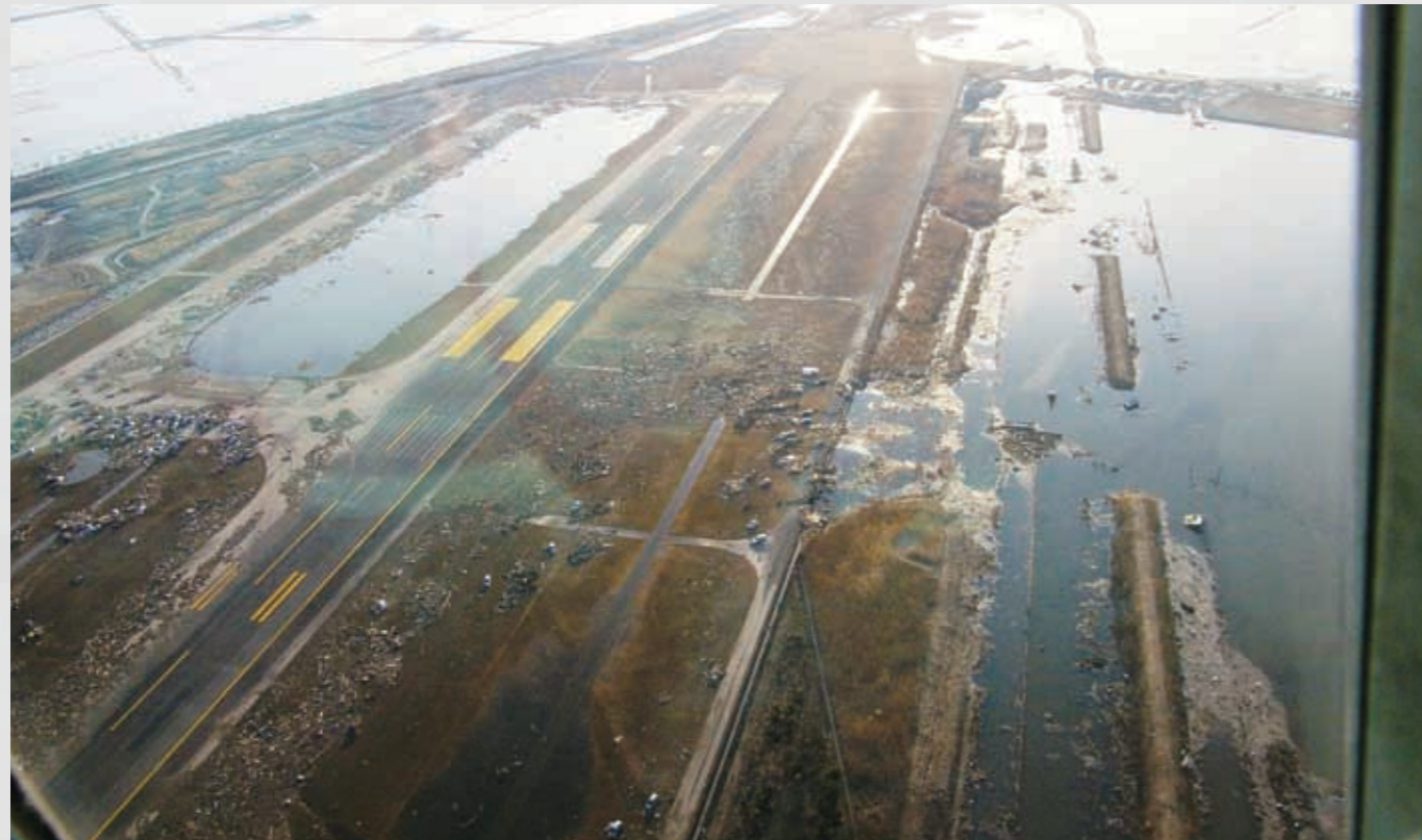
仙台空港滑走路 砂やがれきとともに空港付近の駐車場にあった無数の自動車が流されてきた。 127 平成23年3月13日 松木良夫