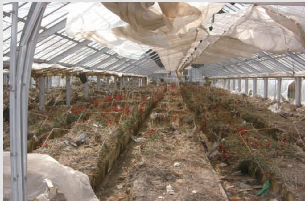
小塚原 ⑪ 平成23年5月7日 名取市