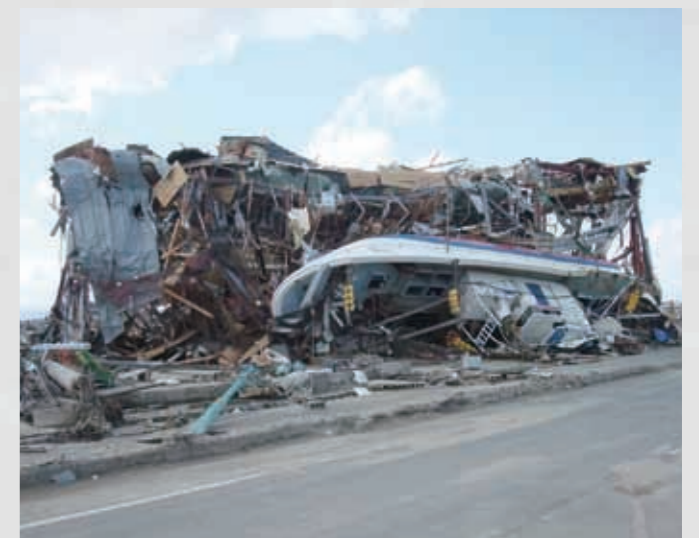
関上4丁目 関上漁港付近 72 平成23年3月23日 個人