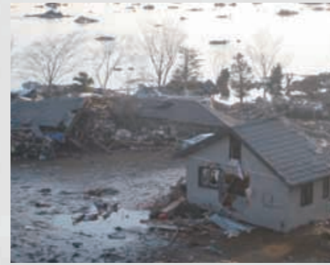
関上中学校校庭 住宅の2階部分が流されてきている。 ⑩⑩ 平成23年3月12日 八森伸