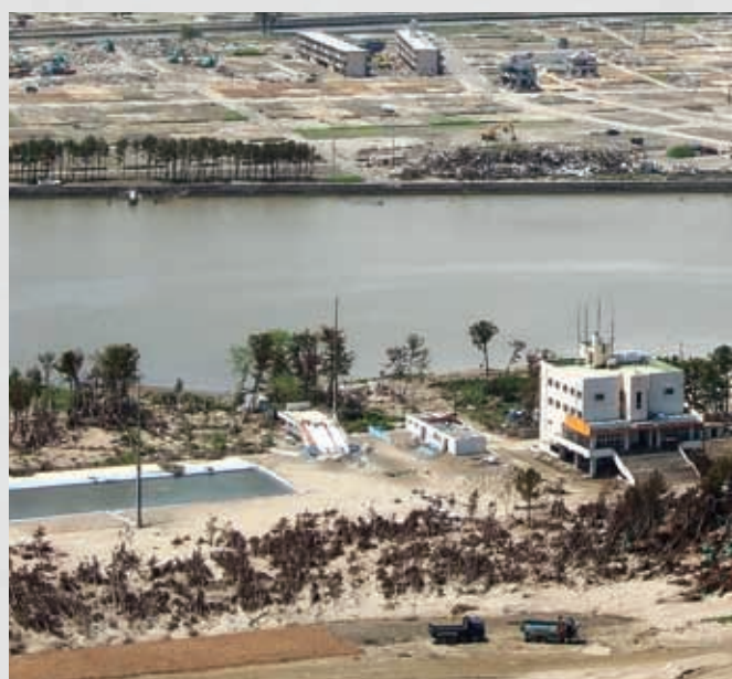
サイクルスポーツセンターと関上海浜プール 65 日付不明 松木良夫