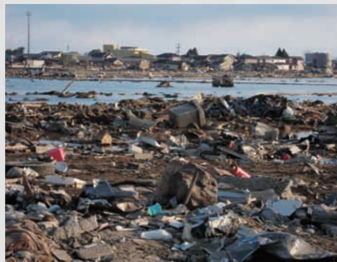
95 平成23年3月27日 高橋祐治