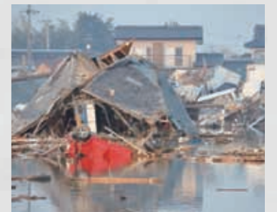
142 平成23年3月13日 東光彦