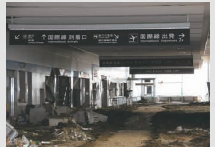
仙台空港ターミナルビル1階内部 133 平成23年4月2日 名取市