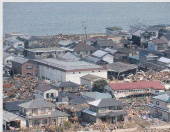
後ろに見えるのは名取川