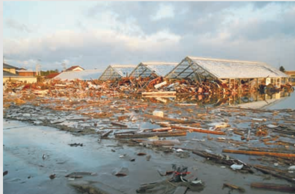
小塚原 東北一の生産量を誇る特産のカーネーションのハウスにも津波が押し寄せた。 ⑩ 平成23年3月12日 名取市