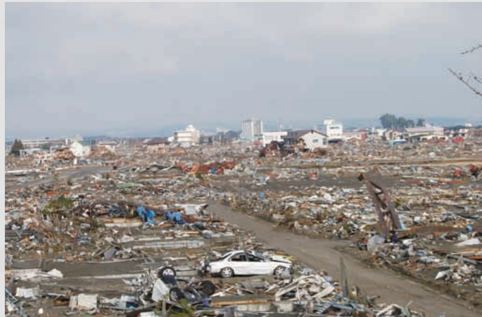
閑上3丁目付近 日和山から見た住宅地跡 84 平成23年3月26日 橋浦精麦倉庫(株)