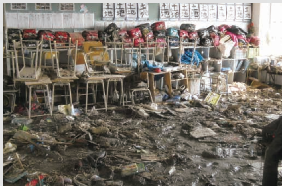
関上小学校1階教室内