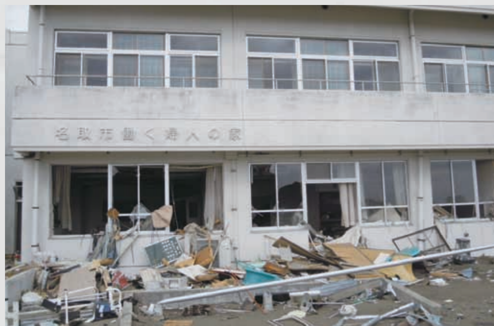
名取市働く婦人の家 86 平成23年4月20日 名取市