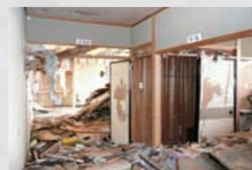
名取市働く婦人の家内部 87 平成23年3月17日 名取市