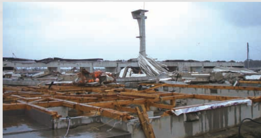
関上漁港魚市場 屋根の鉄板が津波により剥がされ漁港塔に巻き付いている。 68 平成23年3月15日 名取市