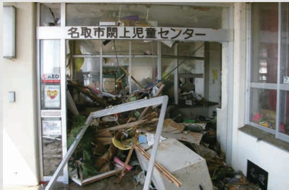
名取市閑上児童センター 名取市の沿岸部の公共施設は、 ほぼ全て津波により被害を受け、 その多くは取り壊された。 85 平成23年3月18日 名取市