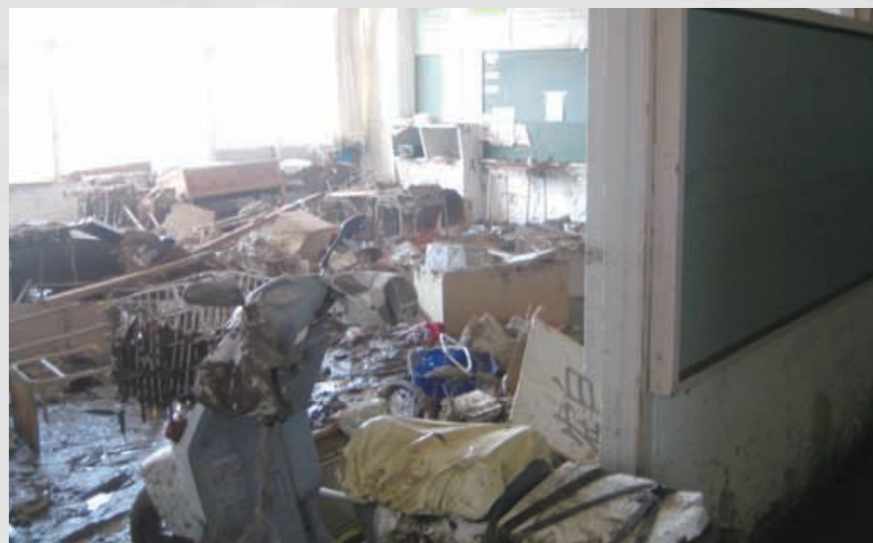
関上中学校1階教室内 ⑩② 平成23年3月14日 八森伸