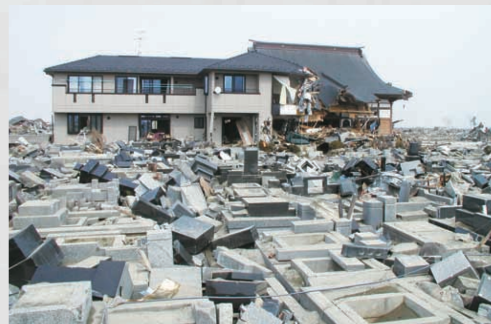
閑上2丁目 震災によって倒れたお墓 90 平成23年3月20日 橋浦精麦倉庫(株)