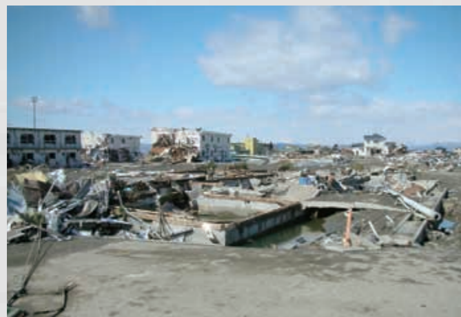
名取市立関上保育所跡