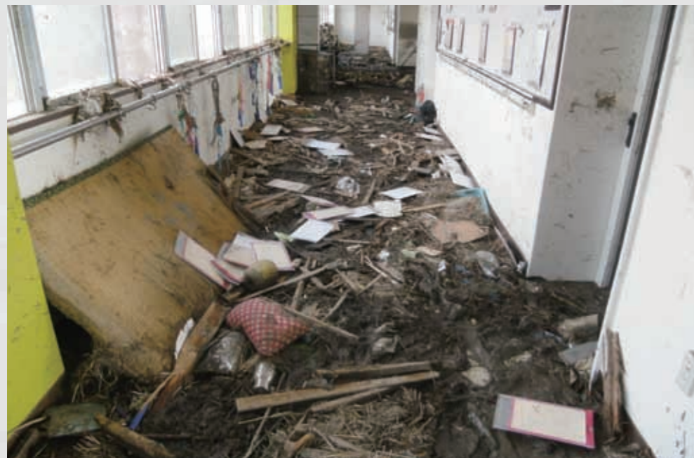
関上小学校1階廊下