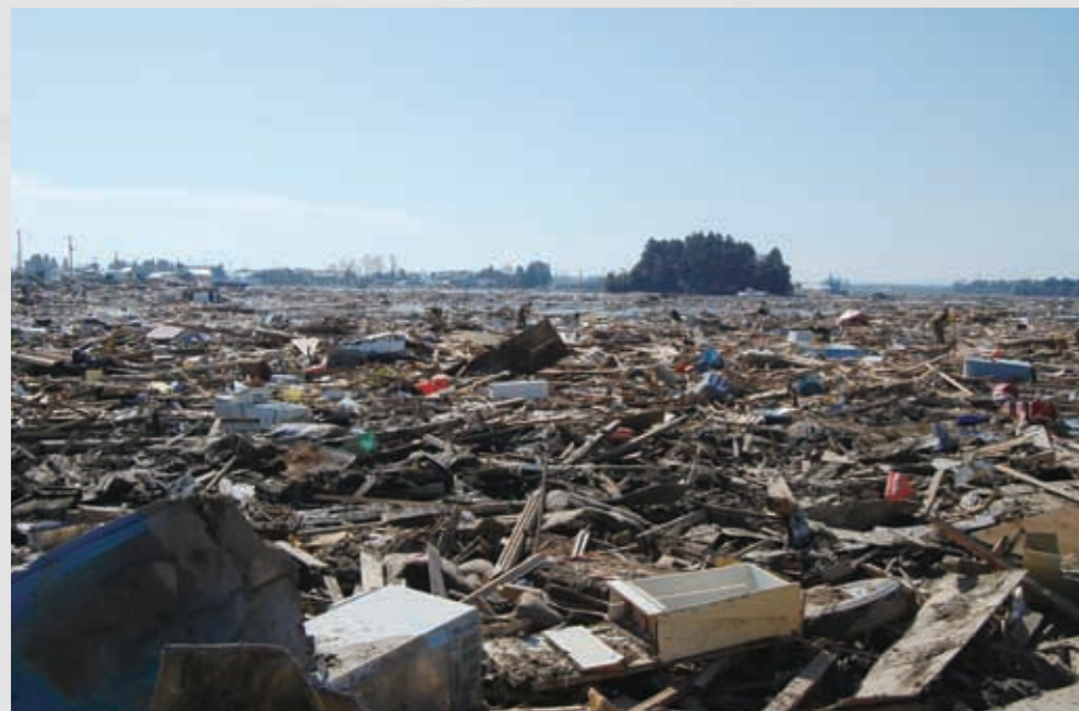
小塚原 本来は一面の田んぼであったが、すべてががれきで埋め尽くされている。 ⑫ 平成23年3月19日 個人