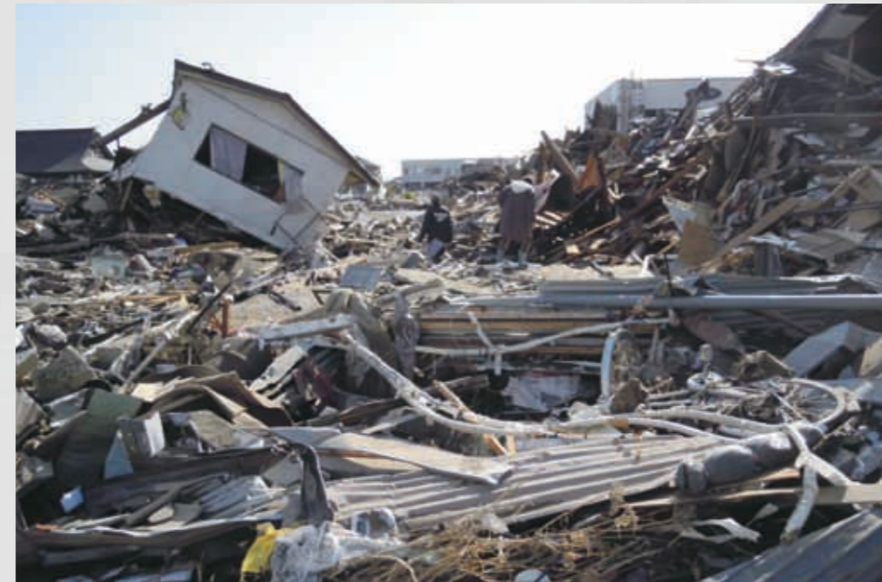
閑上2丁目 88 平成23年3月12日 名取市