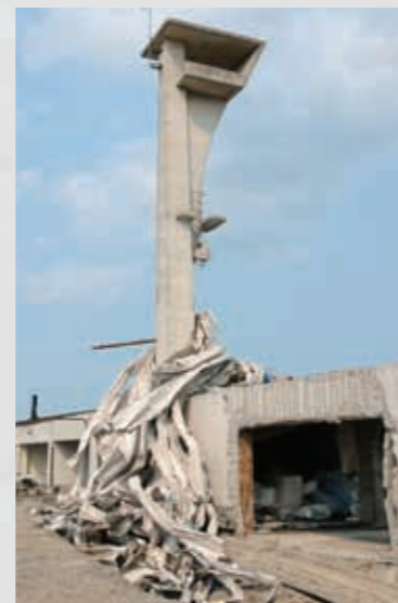
69 平成23年4月2日 名取市