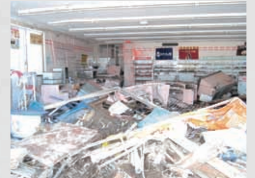
左の写真の店舗内部 ⑩④ 平成23年4月6日 橋浦精麦倉庫(株)