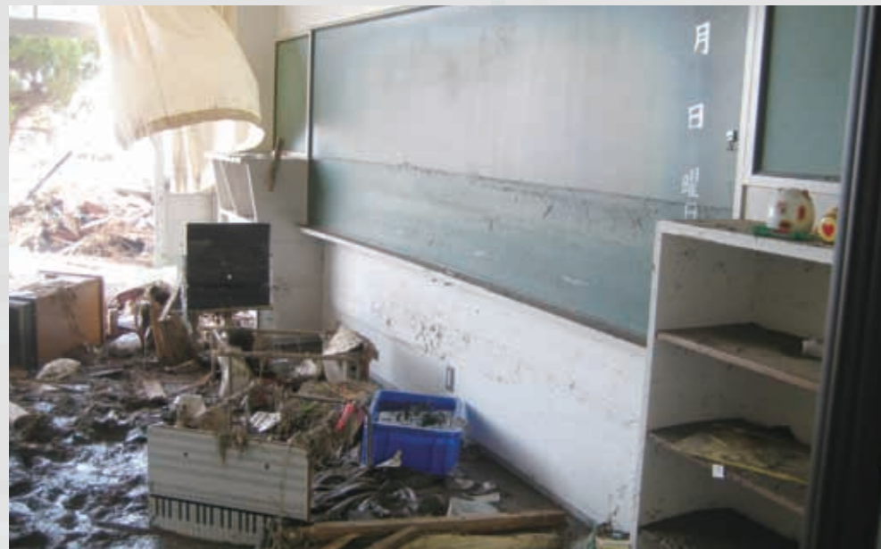
関上中学校1階教室内 黑板に津波の跡が残る。 ⑩① 平成23年3月14日 八森伸