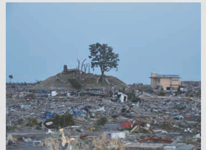
関上3丁目付近から見た日和山 74 平成23年3月13日 東光彦