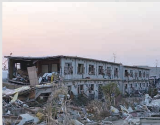
関上6丁目 市営住宅広浦第二団地 77 平成23年3月13日 東光彦