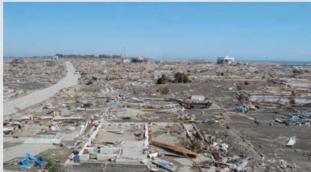
関上4丁目付近 日和山からみた住宅地跡 津波により家屋はほとんど流出し、家の基礎(コンクリート)のみが残った。 67 平成23年3月19日 個人