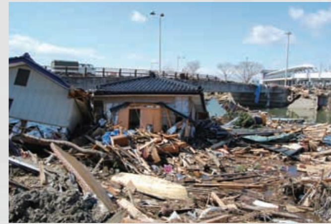
右奥に見えるのが仙台空港アクセス鉄道仙台空港駅