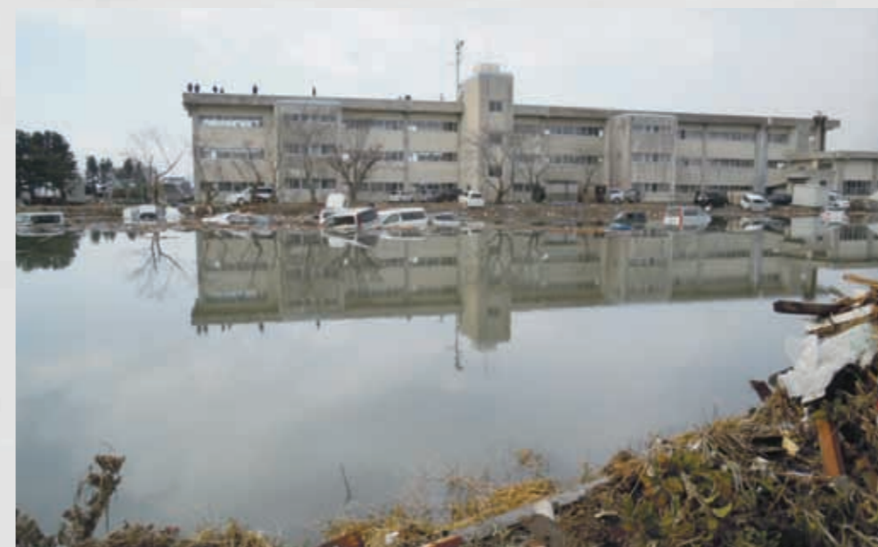
関上小学校 ⑩⑥ 平成23年3月12日 名取市