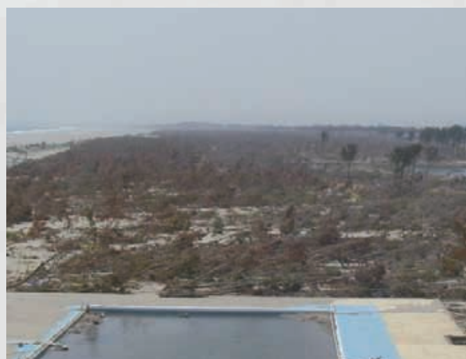
サイクルスポーツセンター屋上から撮影 防潮林のほとんどが津波により倒されている。 この後、生き残った木も塩害により一斉に枯れてしまった。