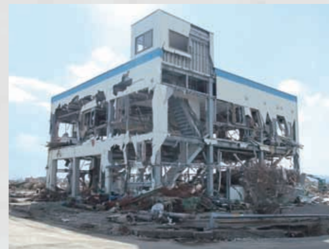
関上4丁目 東北学院シーサイドハウス(ボート部漕艇庫) 71 平成23年3月23日 個人