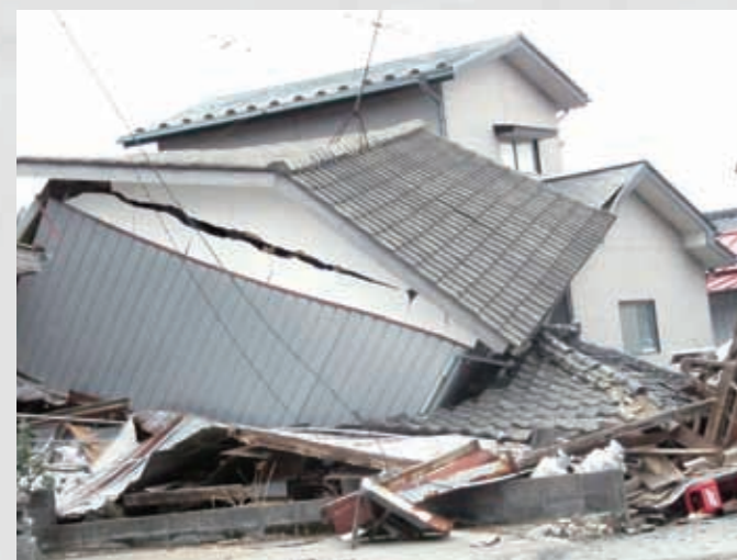
閑上の倒壊した家屋、その後津波が襲来した。