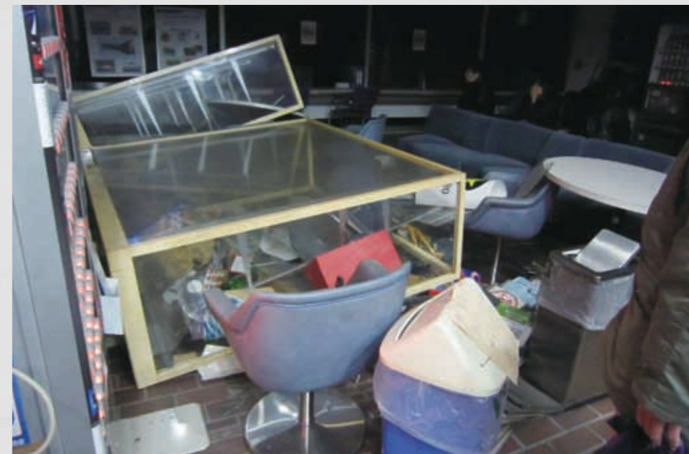
名取市役所ロビー 20 平成23年3月12日 名取市