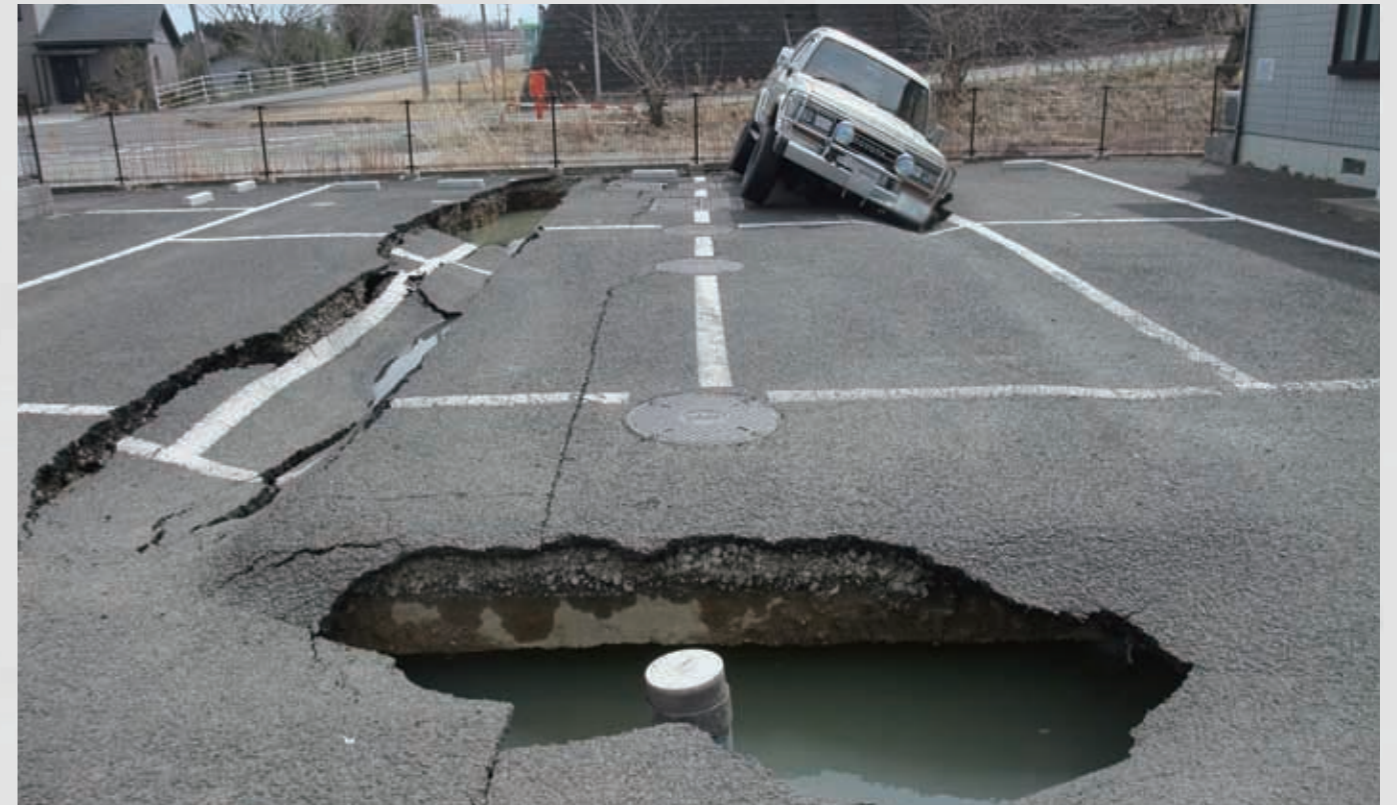
愛島塩手 表面のアスファルトを残し地盤沈下。