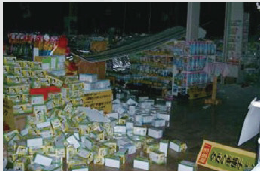
美田園 ホームセンター内 17 日付不明 スーパービバホーム新名取店