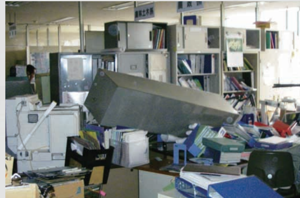
名取市役所内部 19 平成23年3月11日 名取市