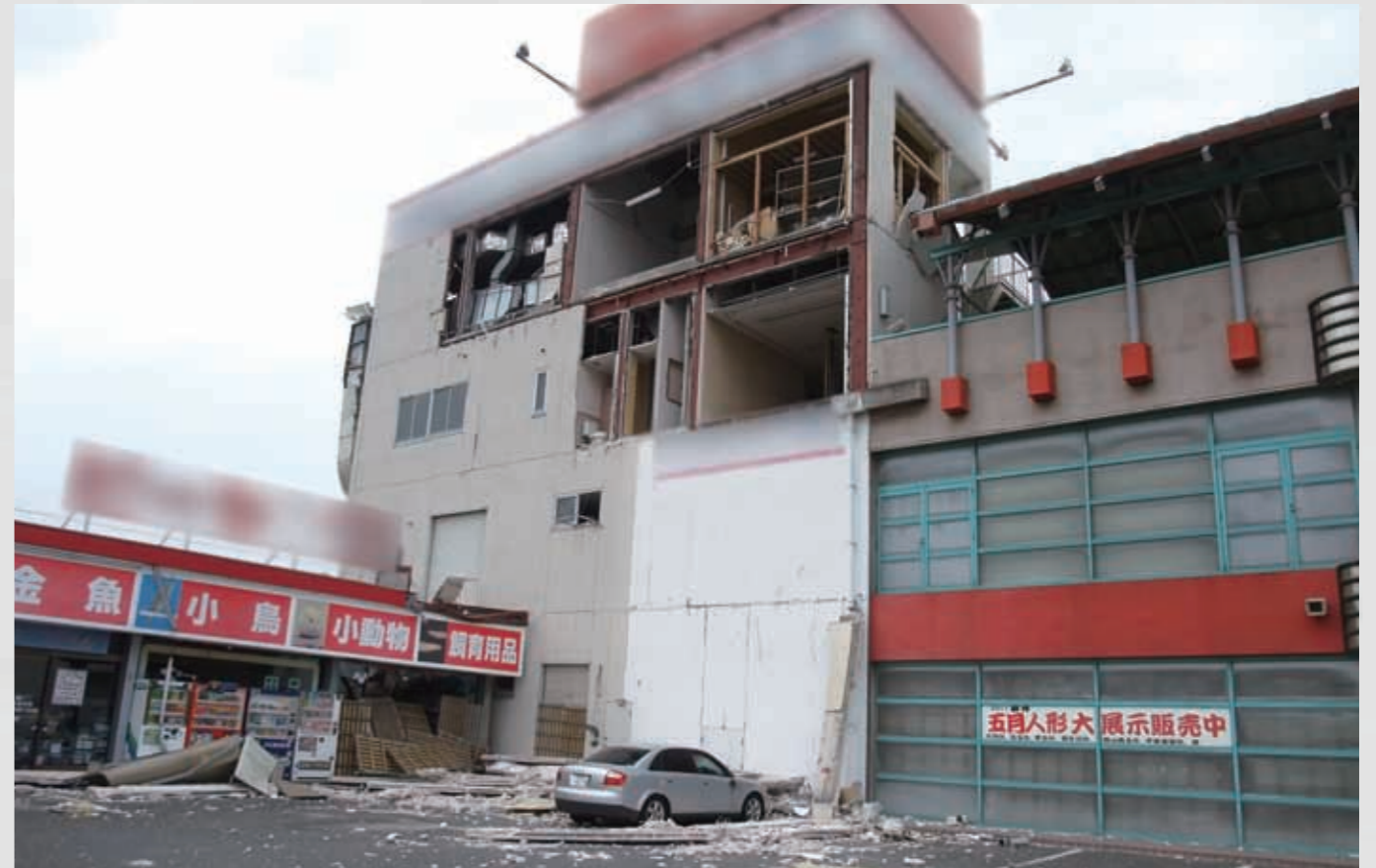
植松 地震動により被害を受けた店舗