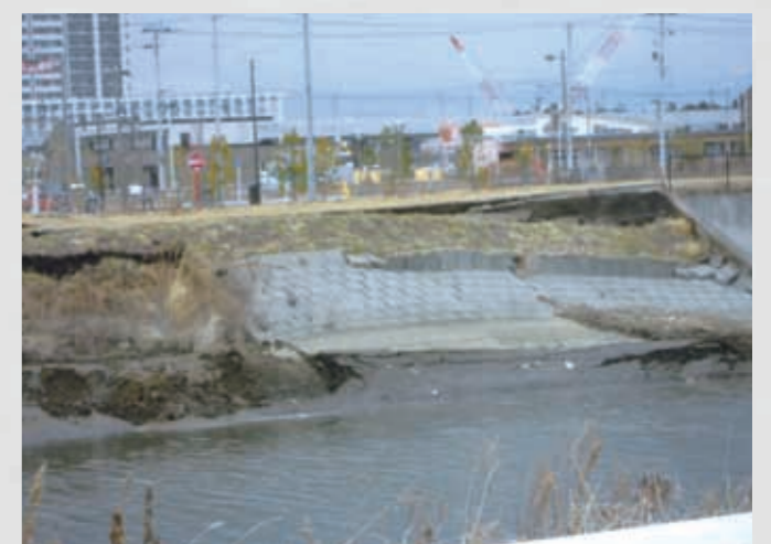
美田園 増田川堤防 土手の一部が崩落。