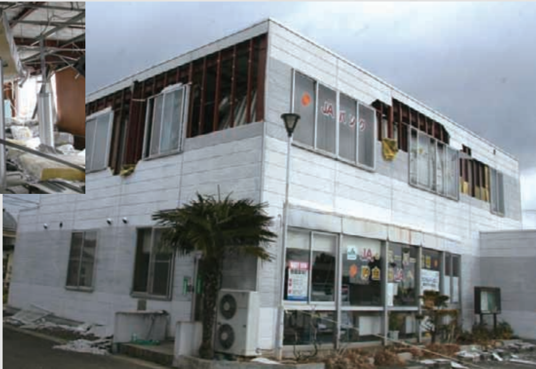
⑨ 日付不明 名取岩沼農業協同組合