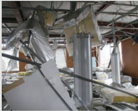
⑧ 日付不明 名取岩沼農業協同組合