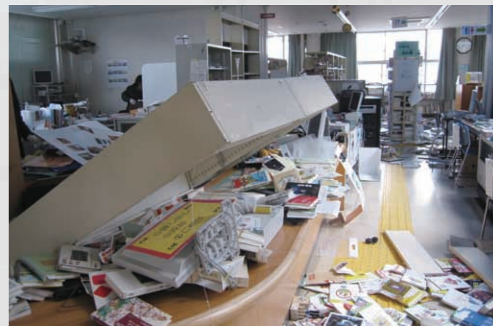
名取市図書館のカウンター付近 市図書館・増田公民館・市民活動支援センターは、建物が古かったこともあり地震動の被害が大きく、使用不能となった。 21 平成23年3月12日 名取市