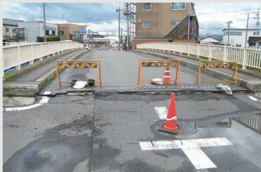
段差ができ、通行止めとなった橋