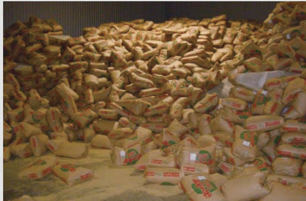
愛島笠島 JAの米倉庫 16 日付不明 名取岩沼農業協同組合