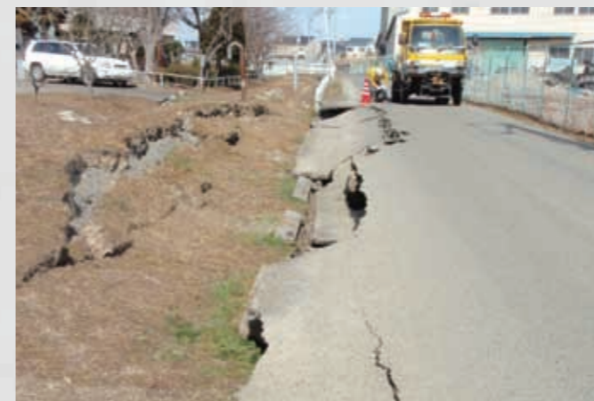
飯野坂 道路や歩道の部分的な沈下や橋の連結部の段差など、地震動により市内各所に被害が発生した。