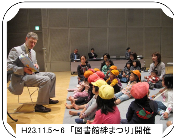
H23.11.5～6 「図書館絆まつり」開催