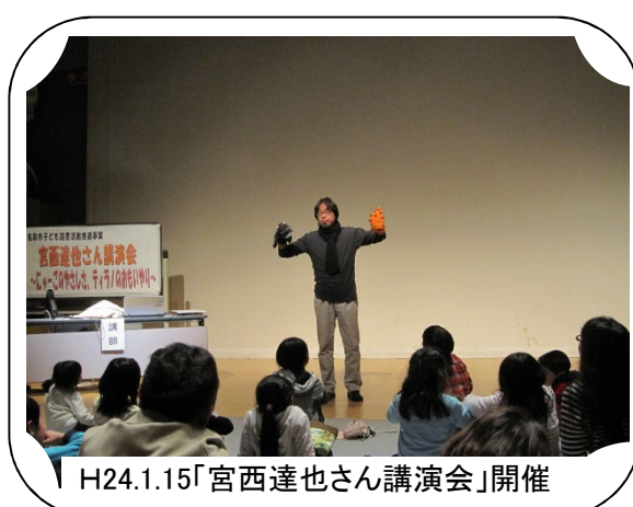
H24.1.15「宮西達也さん講演会」開催