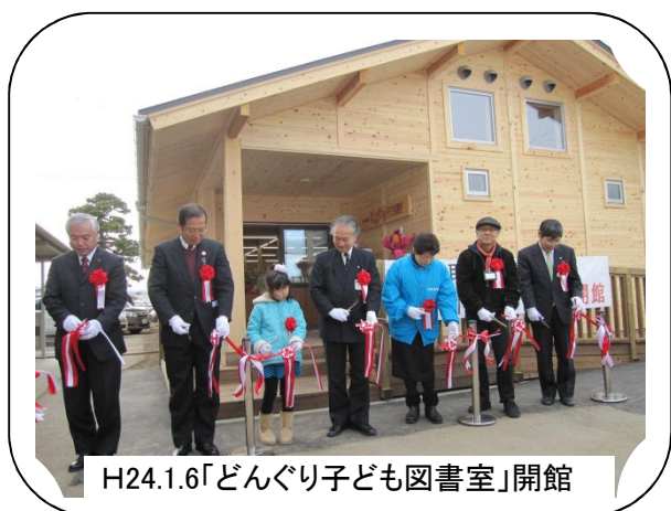
H24.1.6「どんぶり子ども図書室」開館